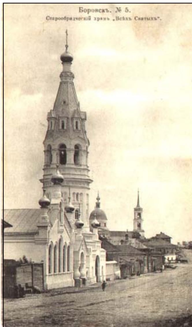
Боровск. Старообрядческий храм Всех Святых.