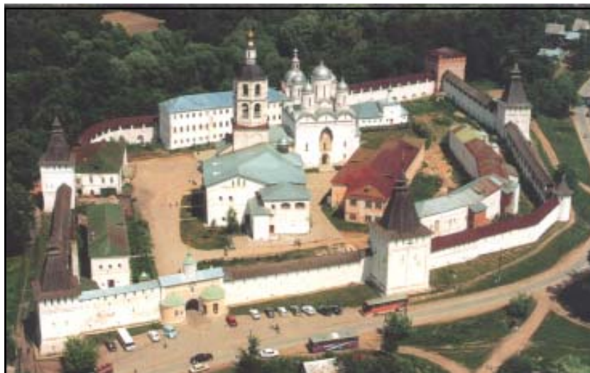
Рождества Пресвятой Богородицы Пафнютьев-Боровский монастырь.

Заказать экскурсии можно по телефонам: (8-484-38) 4-32-36; 4-32-78; 8-910-518-05-97.