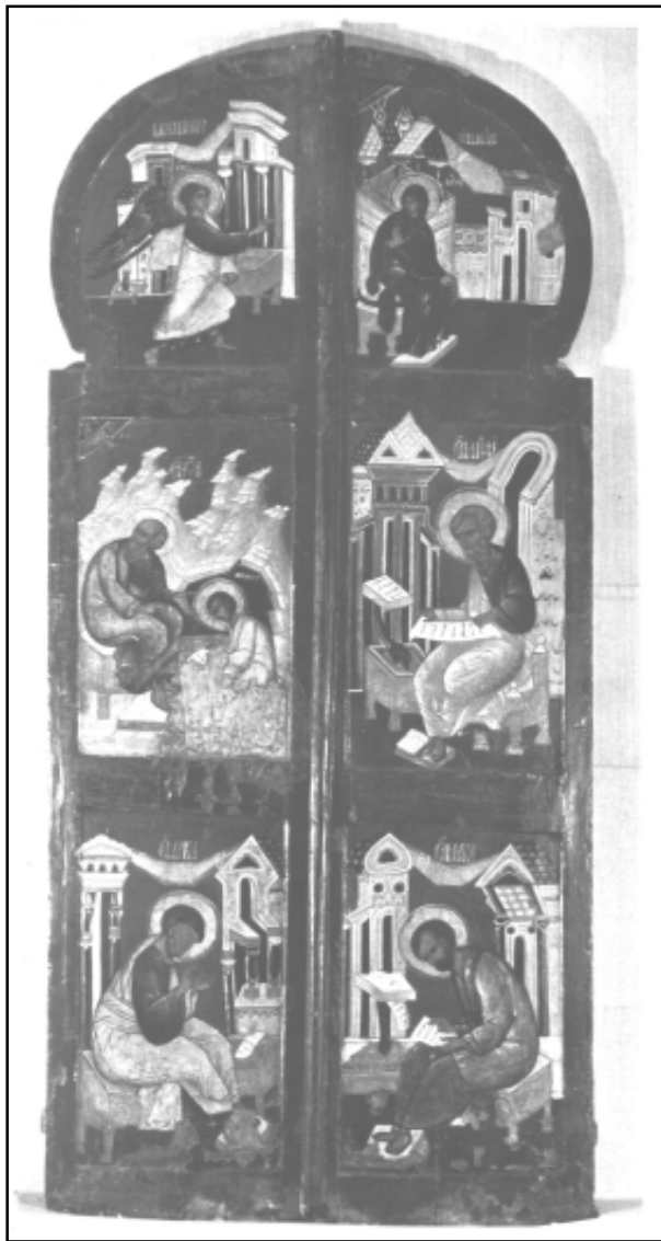
ЦАРСКИЕ ВРАТА ИЗ ЦЕРКВИ МИХАИЛА АРХАНГЕЛА В С. КРАСНОМ. ФОТО 1950-Х ГОДОВ