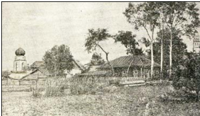
Покровский единовѣрческій храм. Фото 1950-х годов