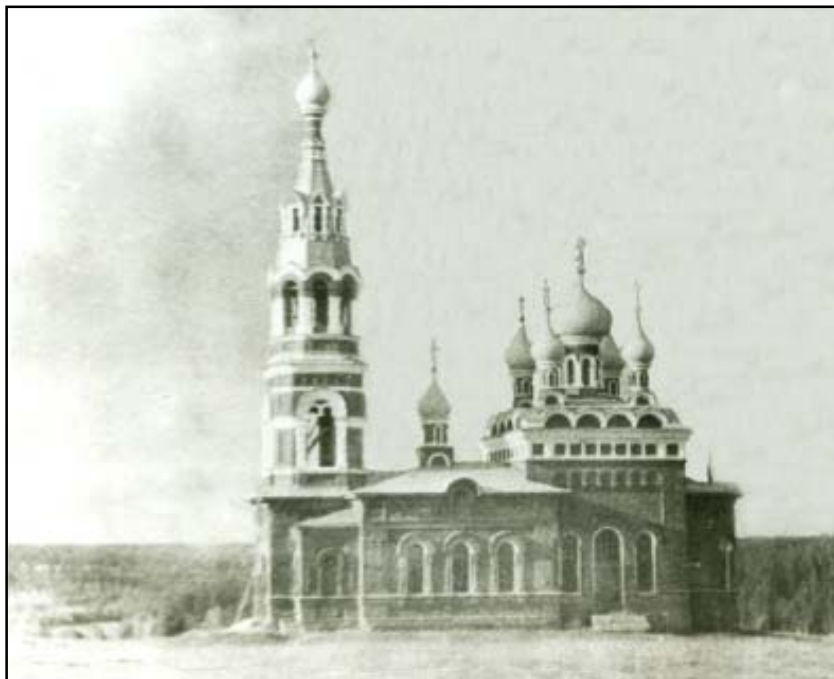
ЦЕРКОВЬ МИХАИЛА АРХАНГЕЛА В С. КРАСНОМ. ФОТО 1950-х ГОДОВ

массу ненужных дорогих вещей. Челищев возмущался и тем, что во вновь построенном храме обваливается штукатурка, не сделан дренаж и не действует центральное отопление, так как печь заливают грунтовые воды, нет ограды. При этом в ходе строительства было истрачено до 80 тыс. руб. «Но куда и на что истрачены?.. Горько! Ведь это мой дед, отец и дядя собрали из грошей 68000 рублей на каменный храм, да ещё пожертвовали до 10000 рублей». Челищев просил Святейший Синод провести следствие (83).