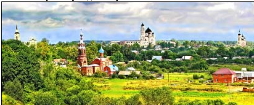
Боровские храмы.