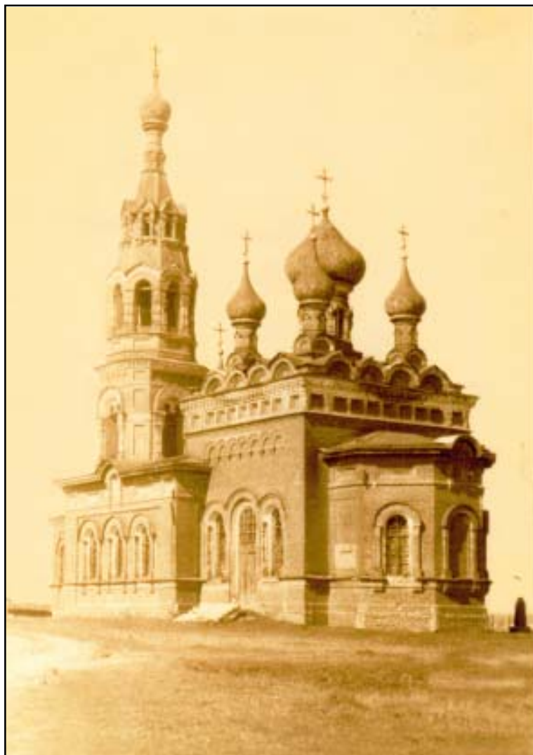
ЦЕРКОВЬ МИХАИЛА АРХАНГЕЛА В С. КРАСНОМ. ФОТО 1968 Г.