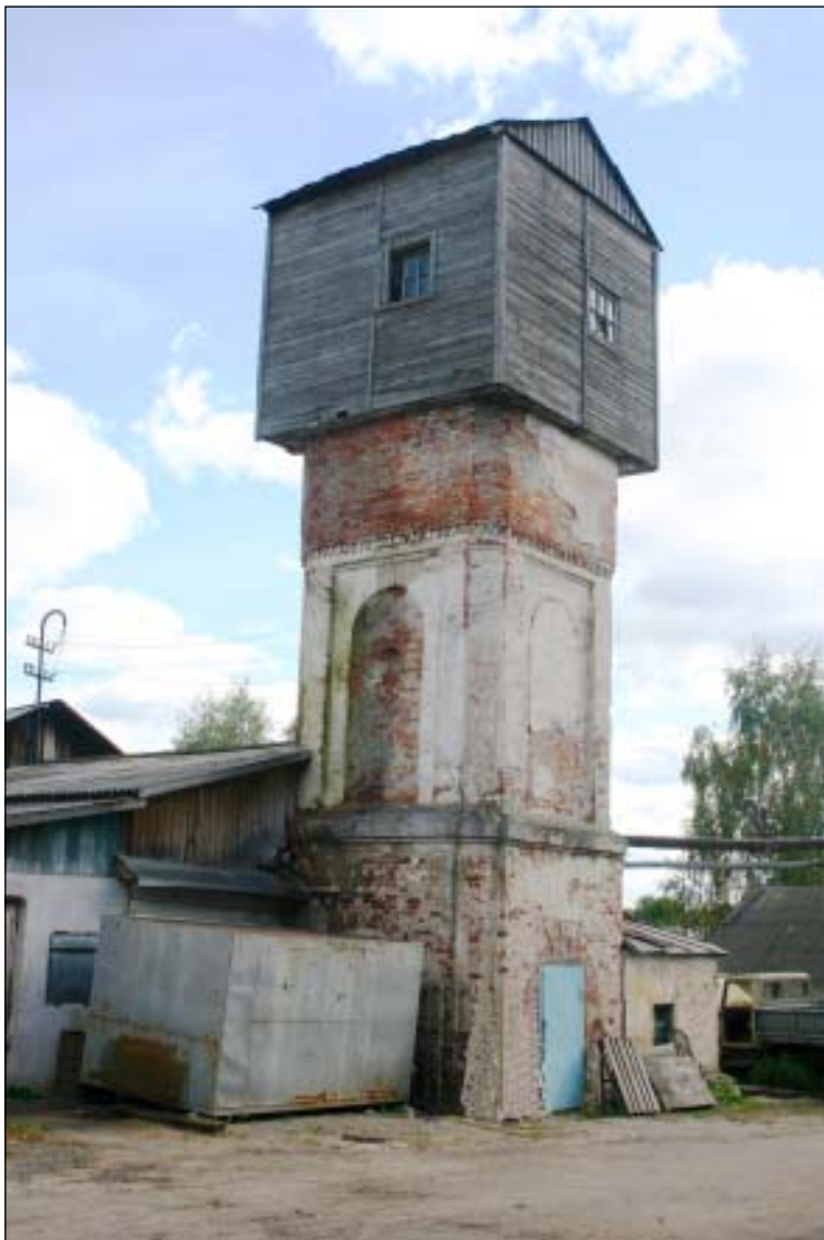
Покровский единовѣрчѣский храм. 14 сентября 2005 г.