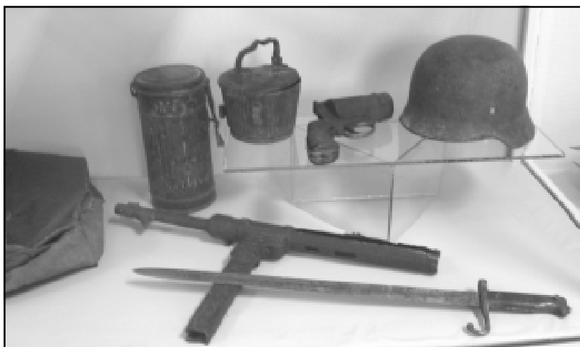
Боровский историко-краеведческий музей. Фрагменты экспозиции «Боровский край в годы Великой Отечественной войны. 1941–1945 гг.»