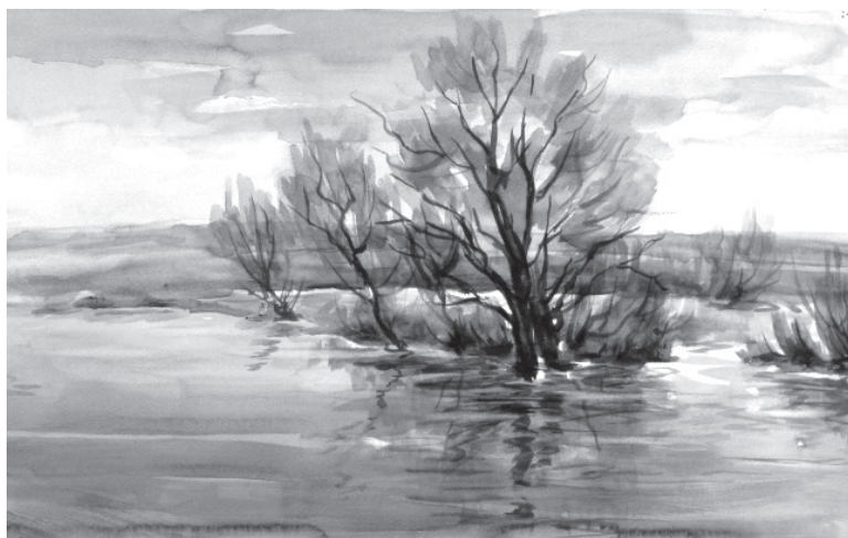
А. Никитенко. Разлив Протвы

24 февраля председатель волисполкома Казанков обращается к комиссару Троицкой фабрики с просьбой выделить взаимобразно на подготовку к паводку 15 тыс.рублей, а также «ввиду ожидаемого большого половодья необходимо