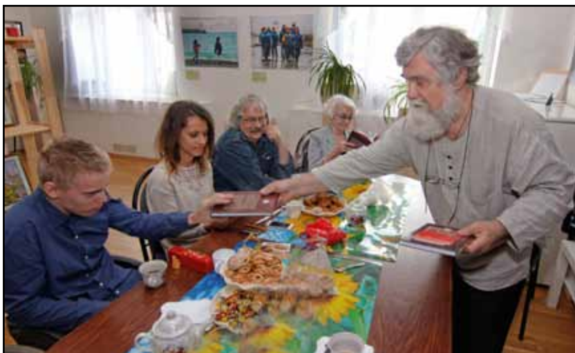
Презентация книги, участие в которой принимали члены нашего отделения «Битва за Москву на Боровской земле. Сборник материалов II Боровской научно-практической конференции „Битва за Москву на Боровской земле (октябрь 1941—январь 1942 гг.). Боровск, 18 ноября 2016 г.“». Боровск, 2017.