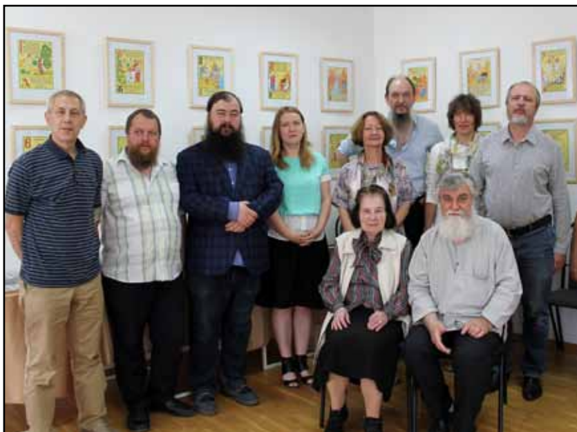
Участники круглого стола. 28-29 июня 2017 г.