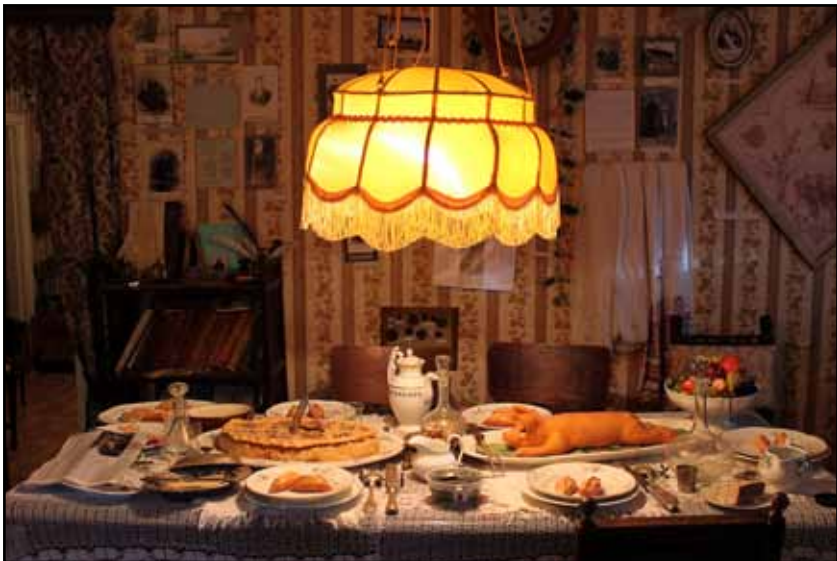
Заседание 25 мая 2016 г. в Музее истории купечества и предпринимательства (Боровск, ул. Ленина, 18).