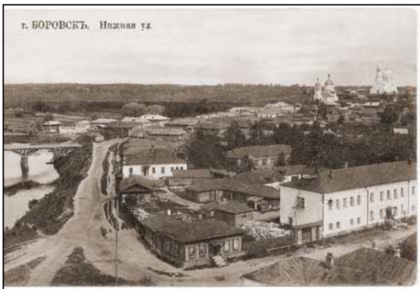
Боровск. Фото 1910-е гг.

На переднем плане двухэтажное белое здание городской больницы.