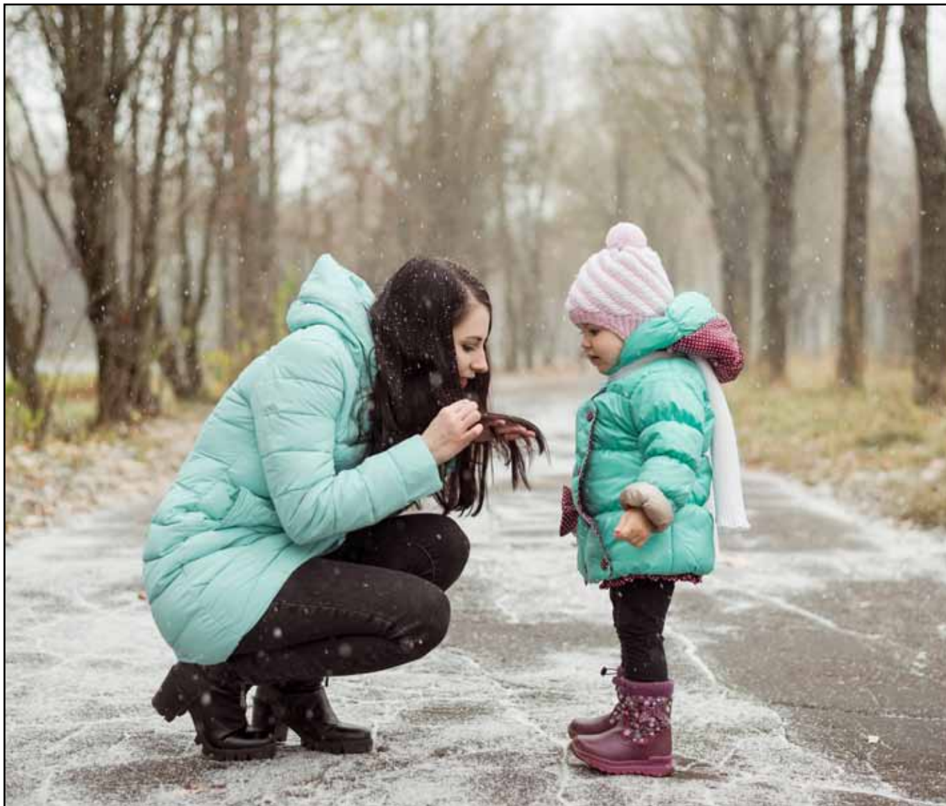
Начало открытий... Мама и дочка.....