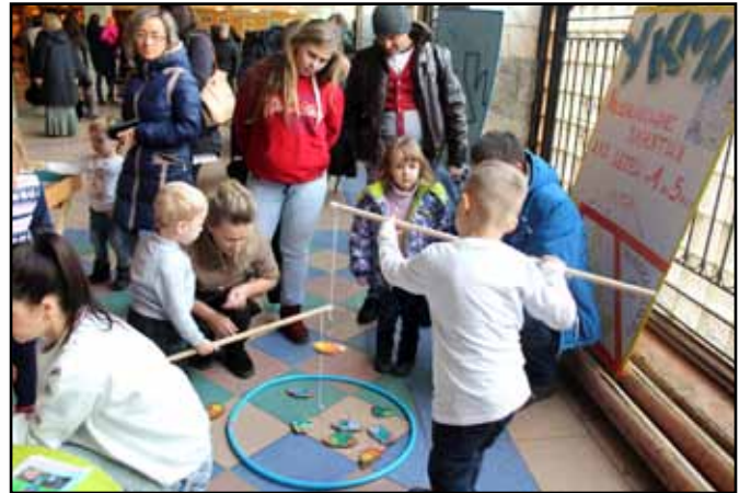
О втором слете активных мам читайте на с.5-6.