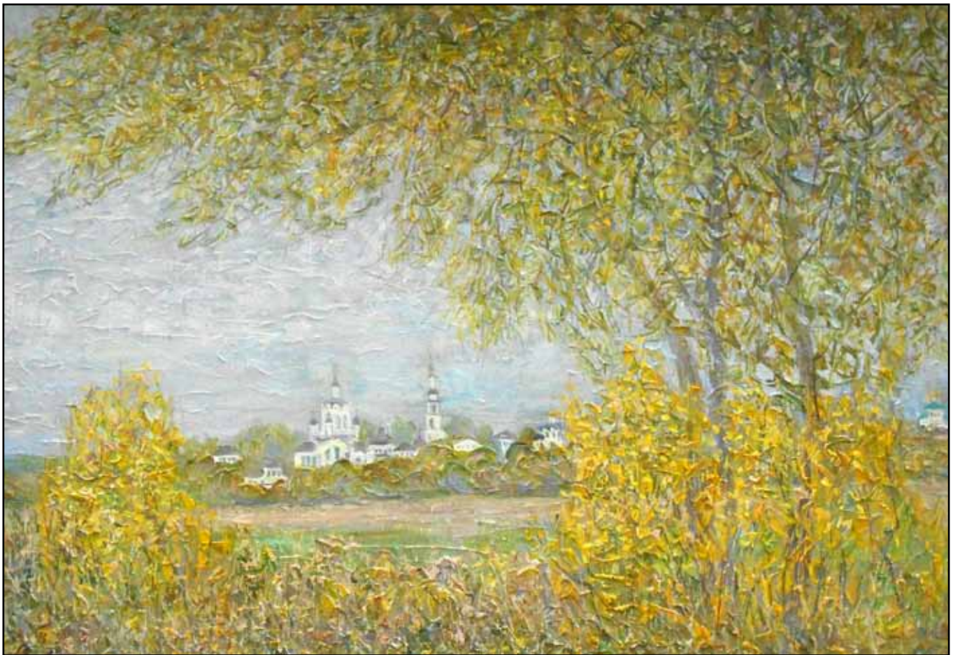
Грустная пора осени. Малоярославец. 2014-2015 гг. Холст, орг., масло. 53x77.