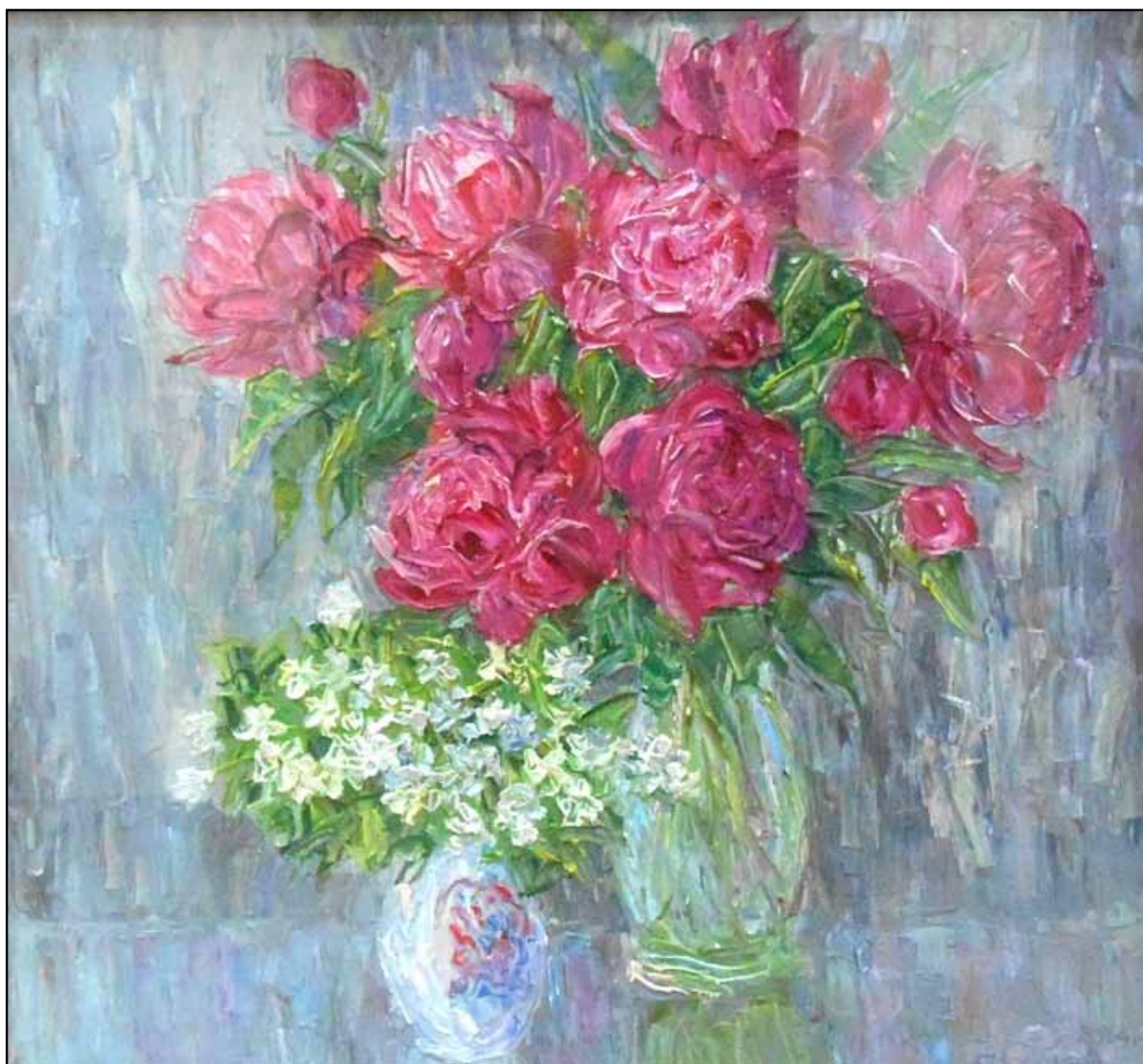
Красные пионы и жасмины. 2017. Холст, масло. 145x220.