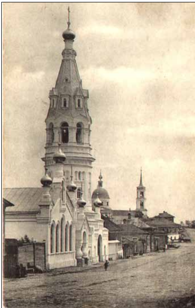
Старообрядческий храм Всех Святых. Фотография 1910-е годы.