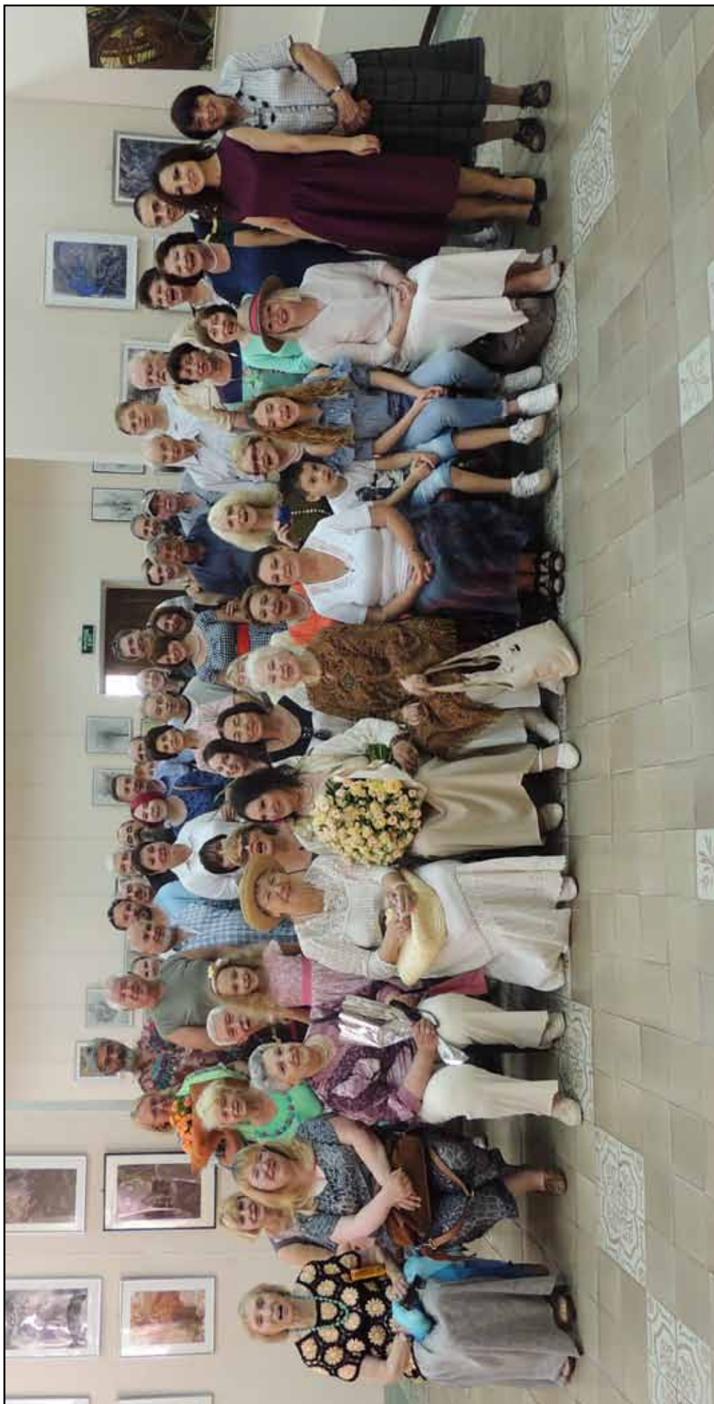
В кругу друзей.