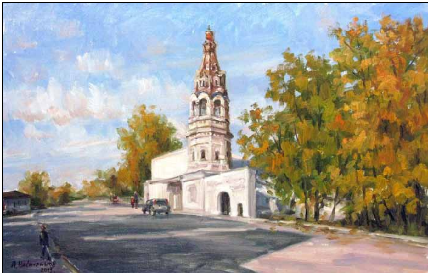
А.А. Никитенков. Боровская «Картинка». 2013 г.