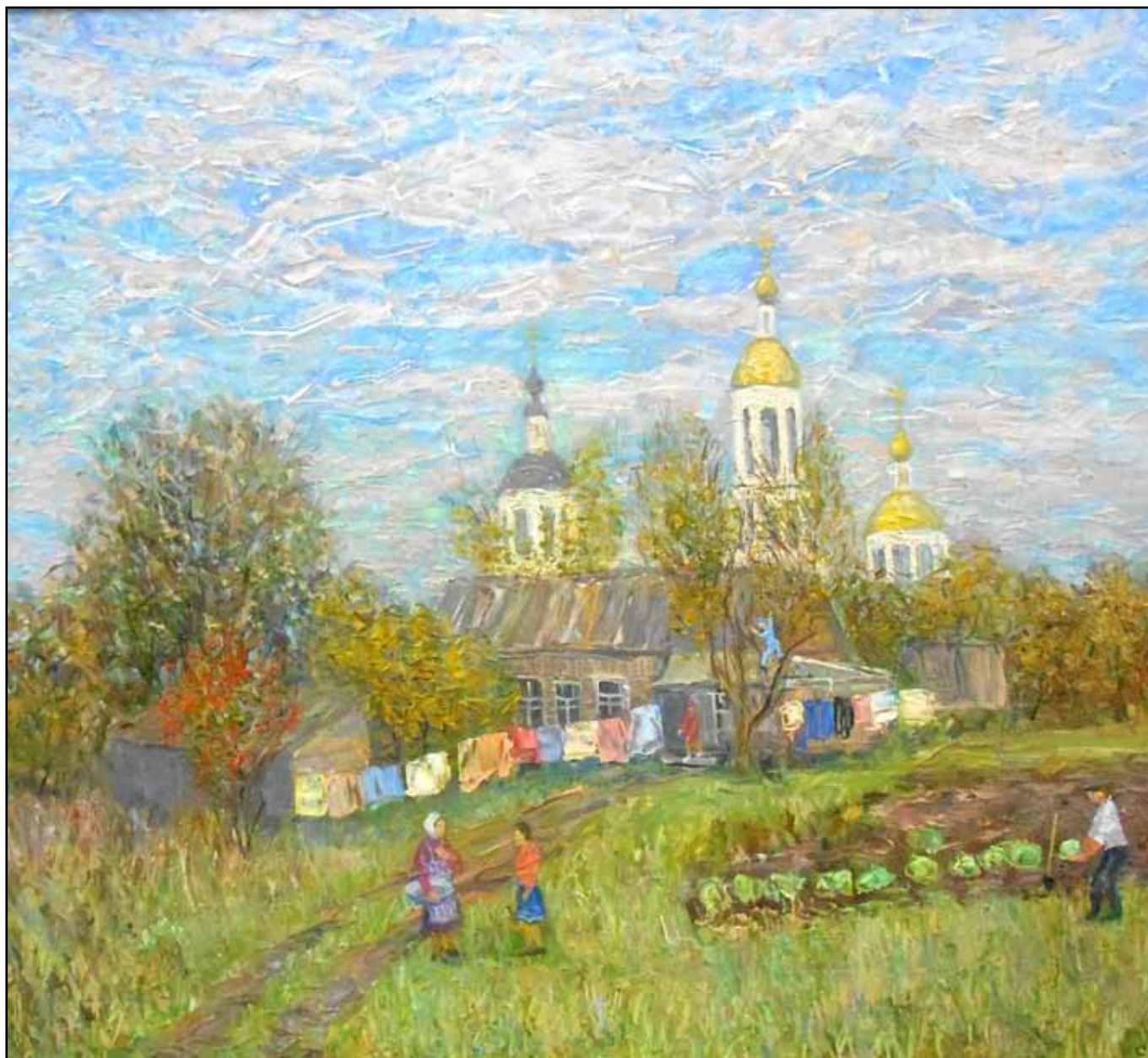
Радостный день осени. Село Клыково. 2013-2014. Холст, оргалит, масло. 76x89.