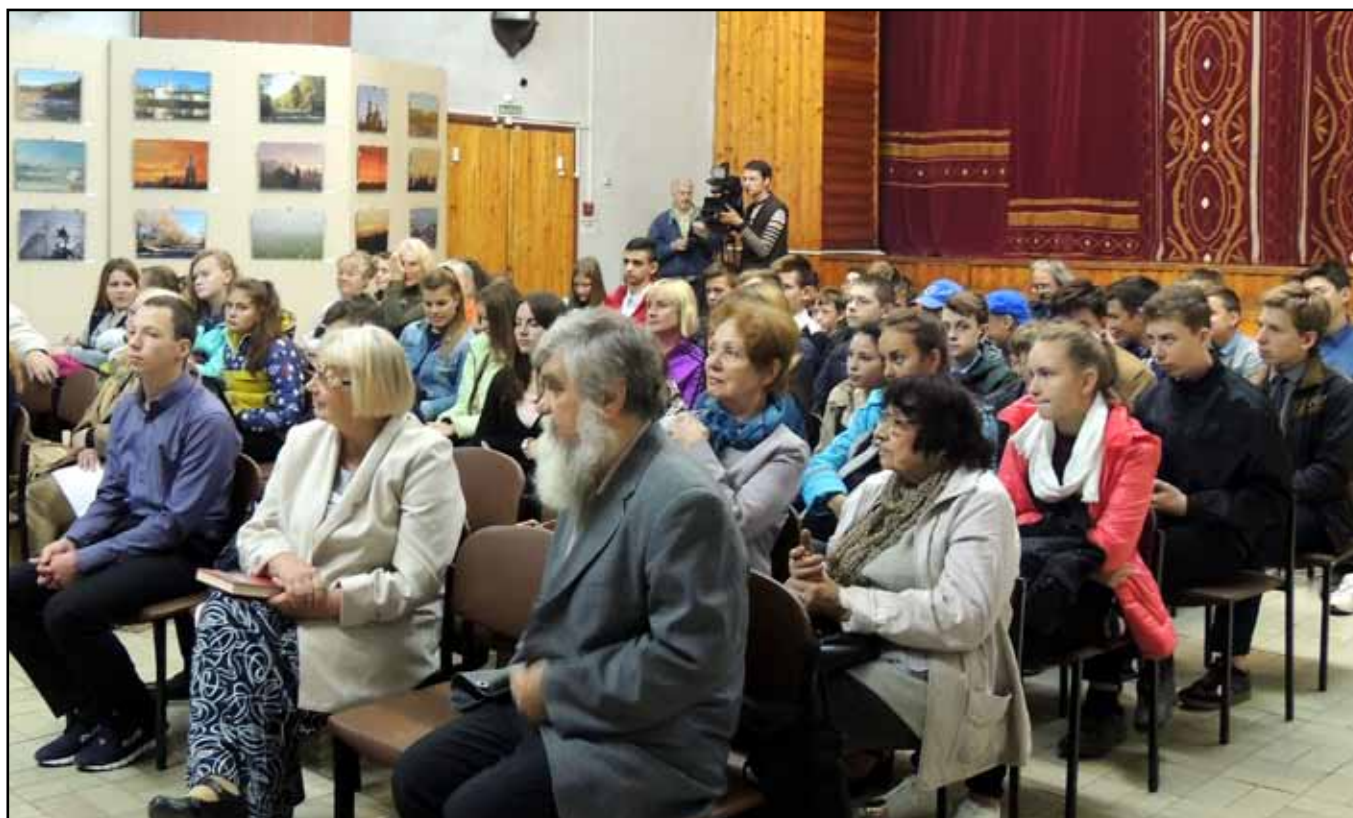
Космос - это всегда интересно...