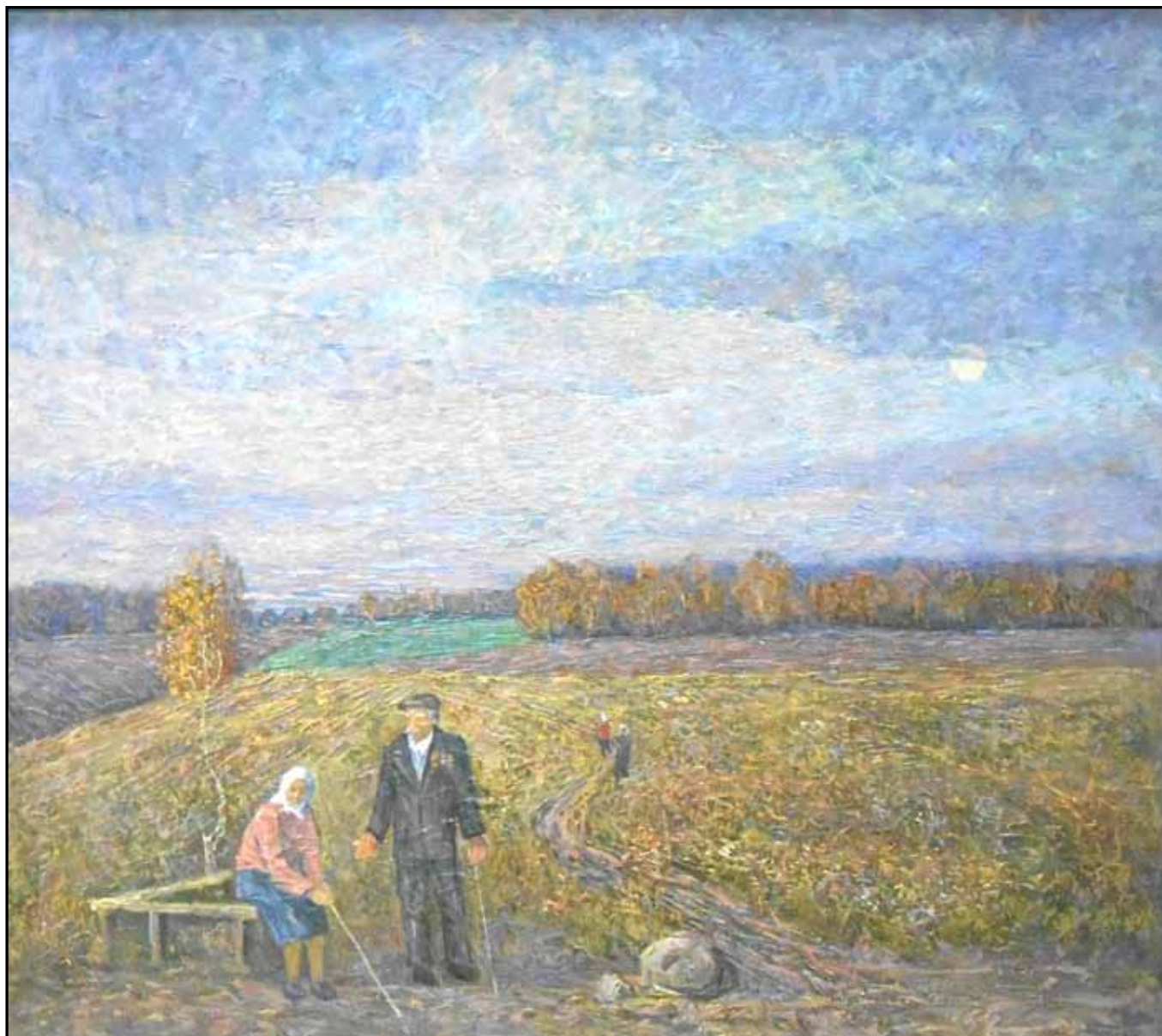
«На обочине жизни». 2010. Холст, двп, масло. 80х90.