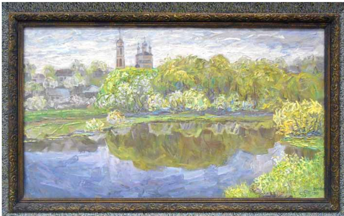
Вечернее любование Боровском. 2017. Холст, масло. 145x220.