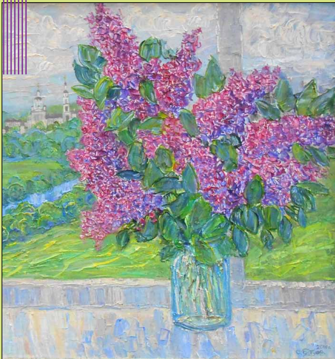
С.А. Бауэр. Персидская сирень. 2017. Холст, масло. 145x220.

ВЕСТНИК МУК «МУЗЕЙНО-ВЫСТАВОЧНЫЙ ЦЕНТР» • Вып.2 • 2017