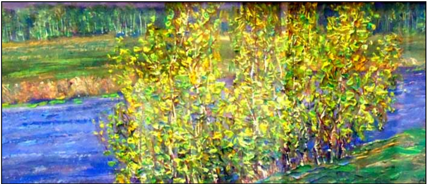
Золото русский берез. 15x77. 2014. Холст, оргалит, масло. 15x77.