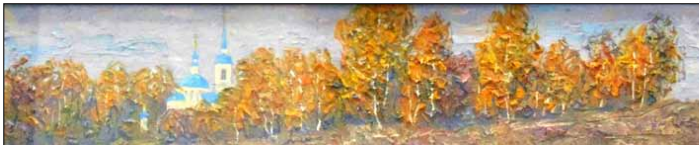
Золотая русская береза. 2017. Холст, масло. 145x220.