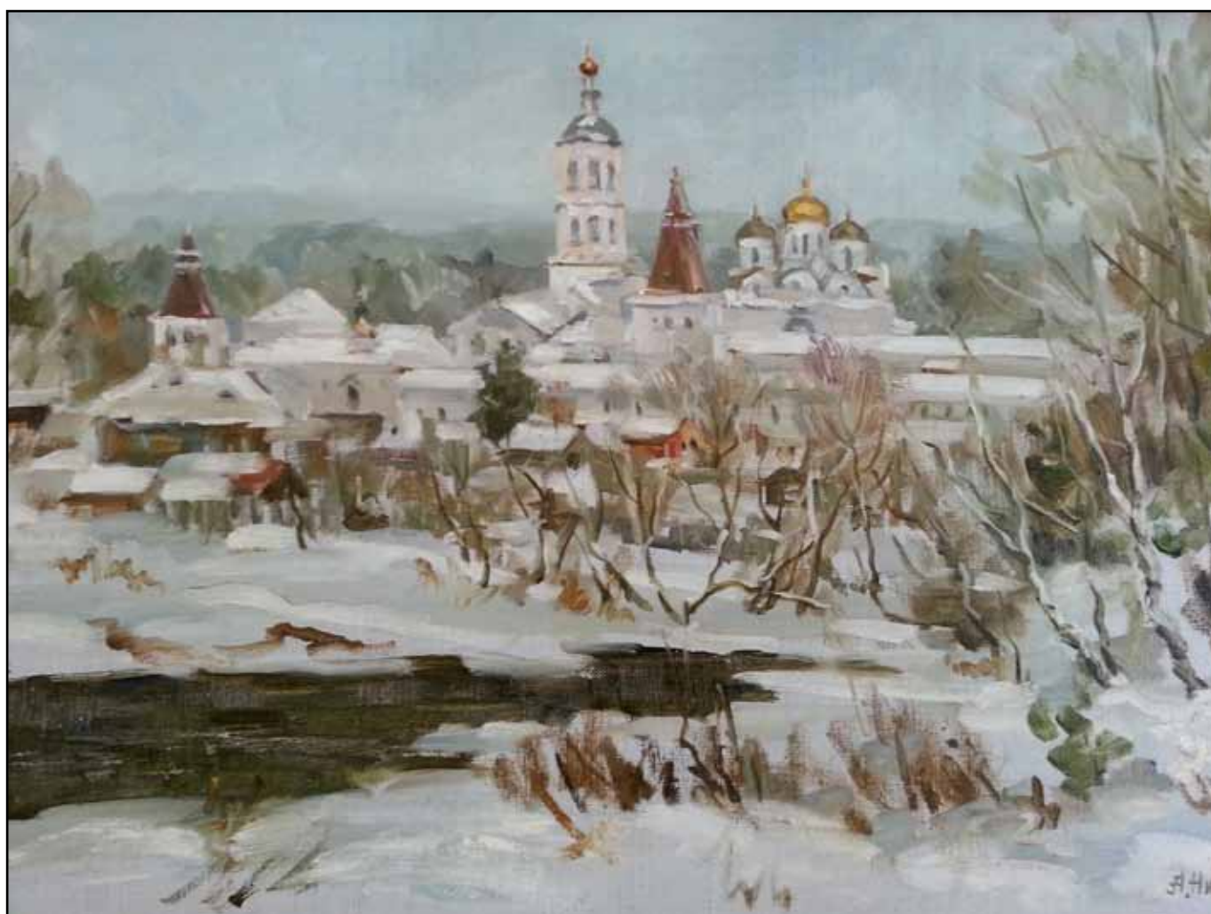
А.А. Никитенков. Пафнутьев-Боровский монастырь. 2013 г.