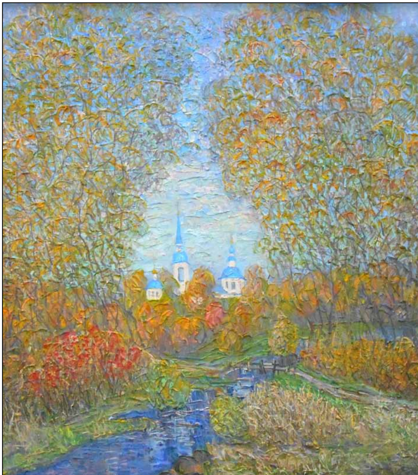
Карижа - души моей святыня. 2014-2015 гг. Холст, орг., масло. 77x87.