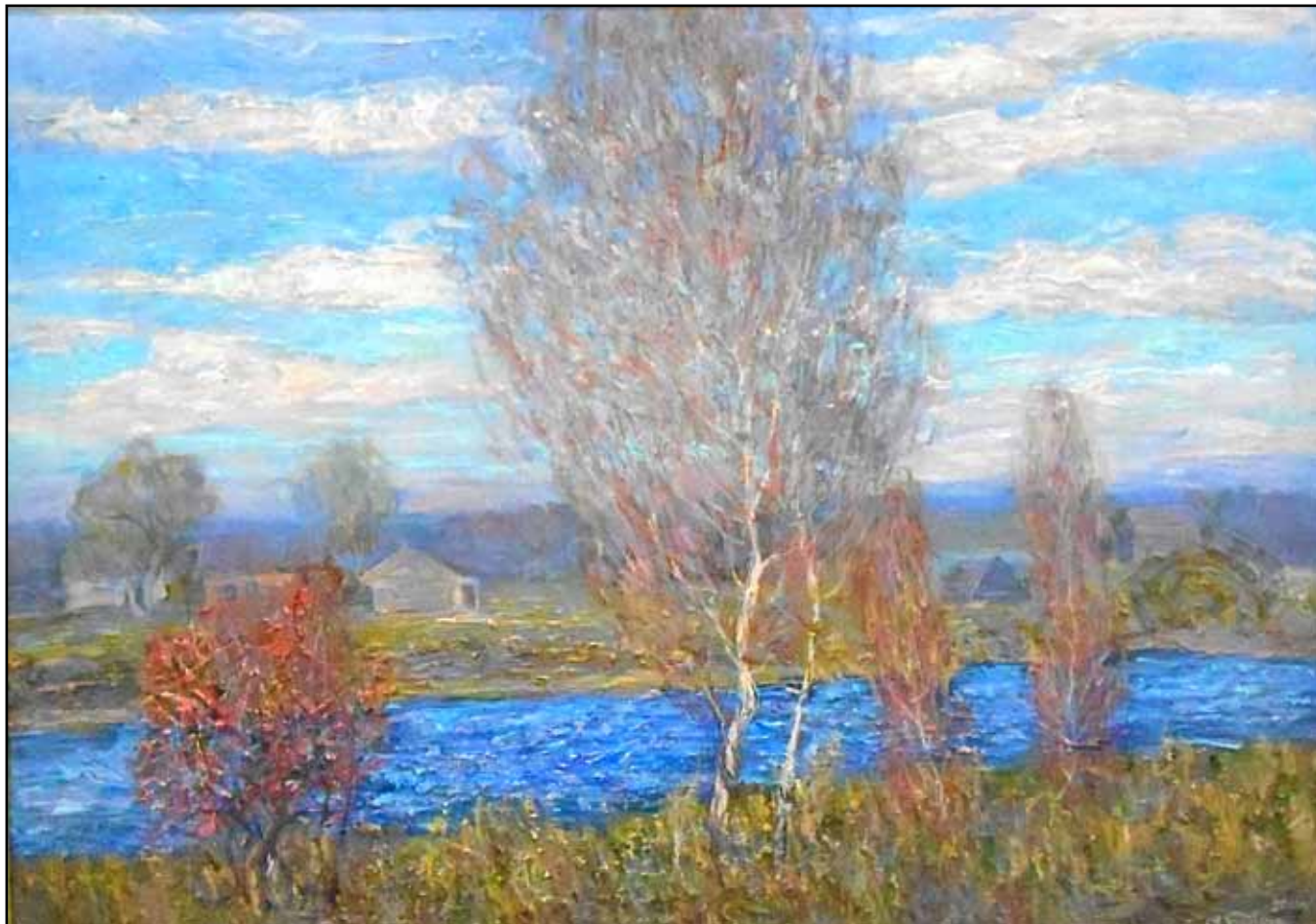
Синий апрель. 2017. Холст, масло. 145x220.