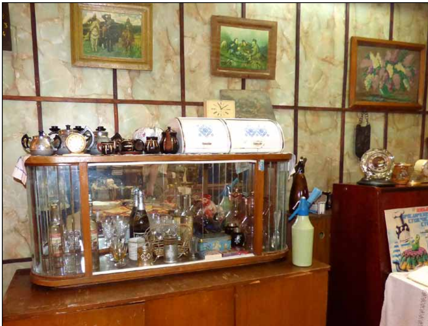
Фрагмент выставки «Ностальгия».