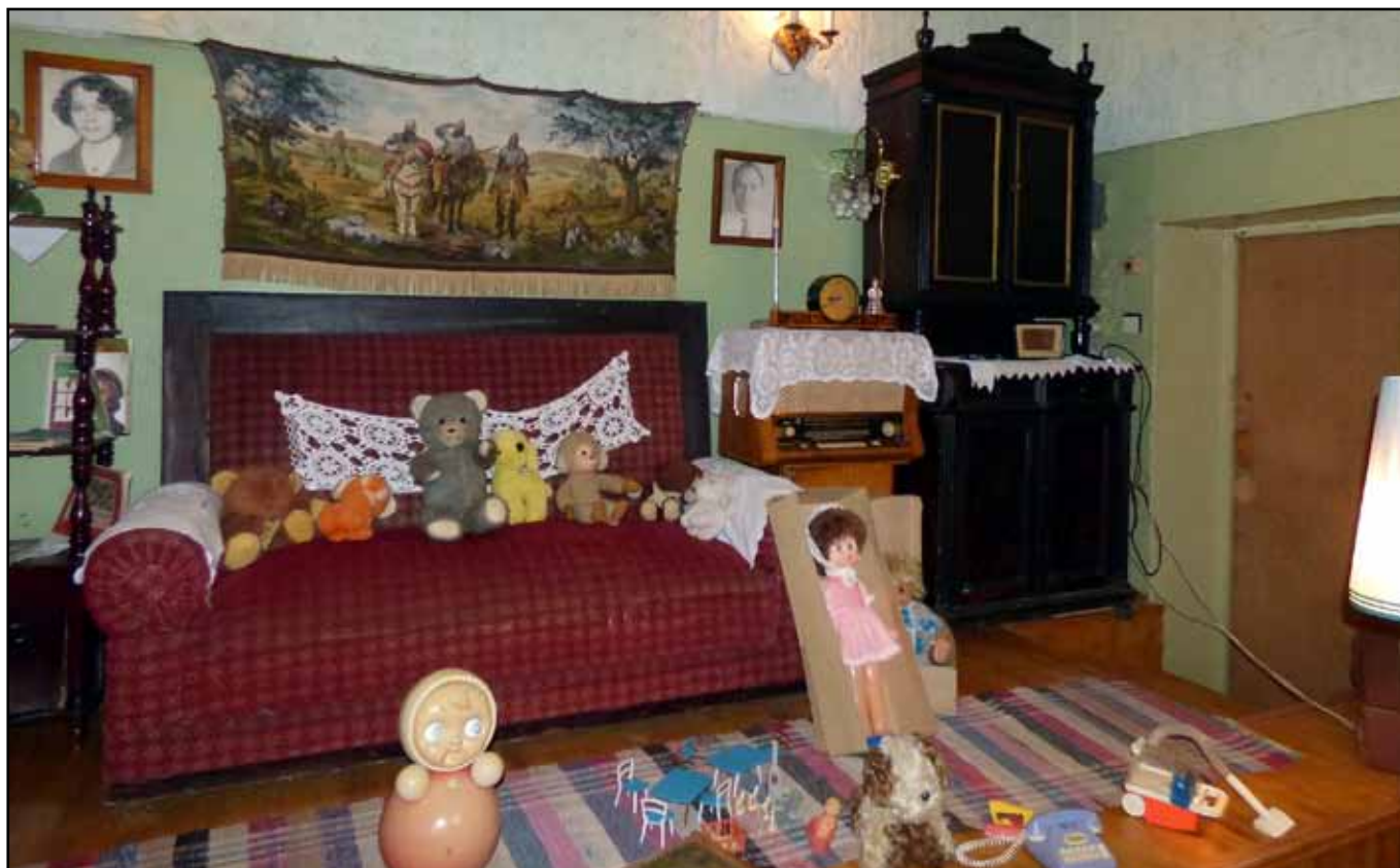
Фрагмент выставки «Ностальгия».

Адрес: г. Боровск, ул. Калужская обл., г. Боровск, ул. Ленина, д.27; Тел./факс: 8 (48438) 4-27-04 / mvc-borovsk@yandex.ru .