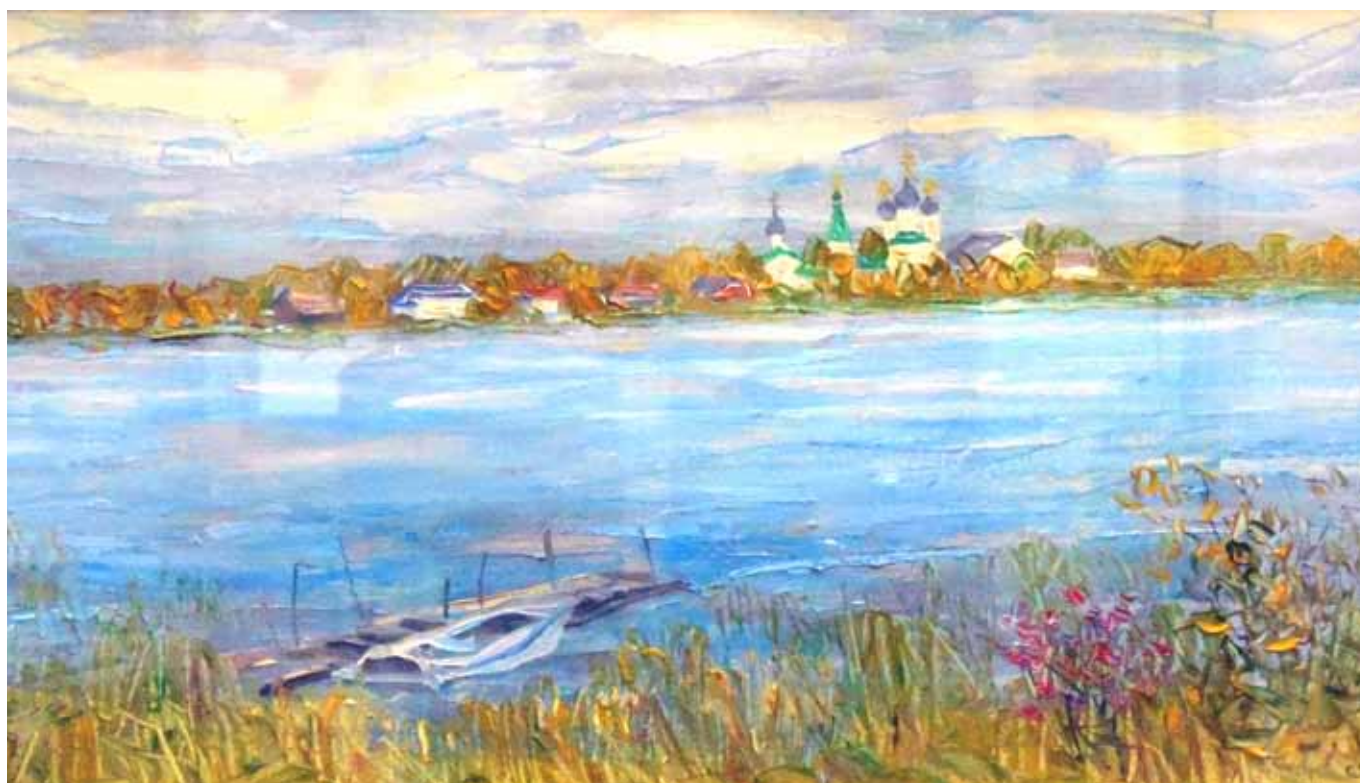
Антонио Сийский монастырь. 2017. Холст, масло. 145x220.