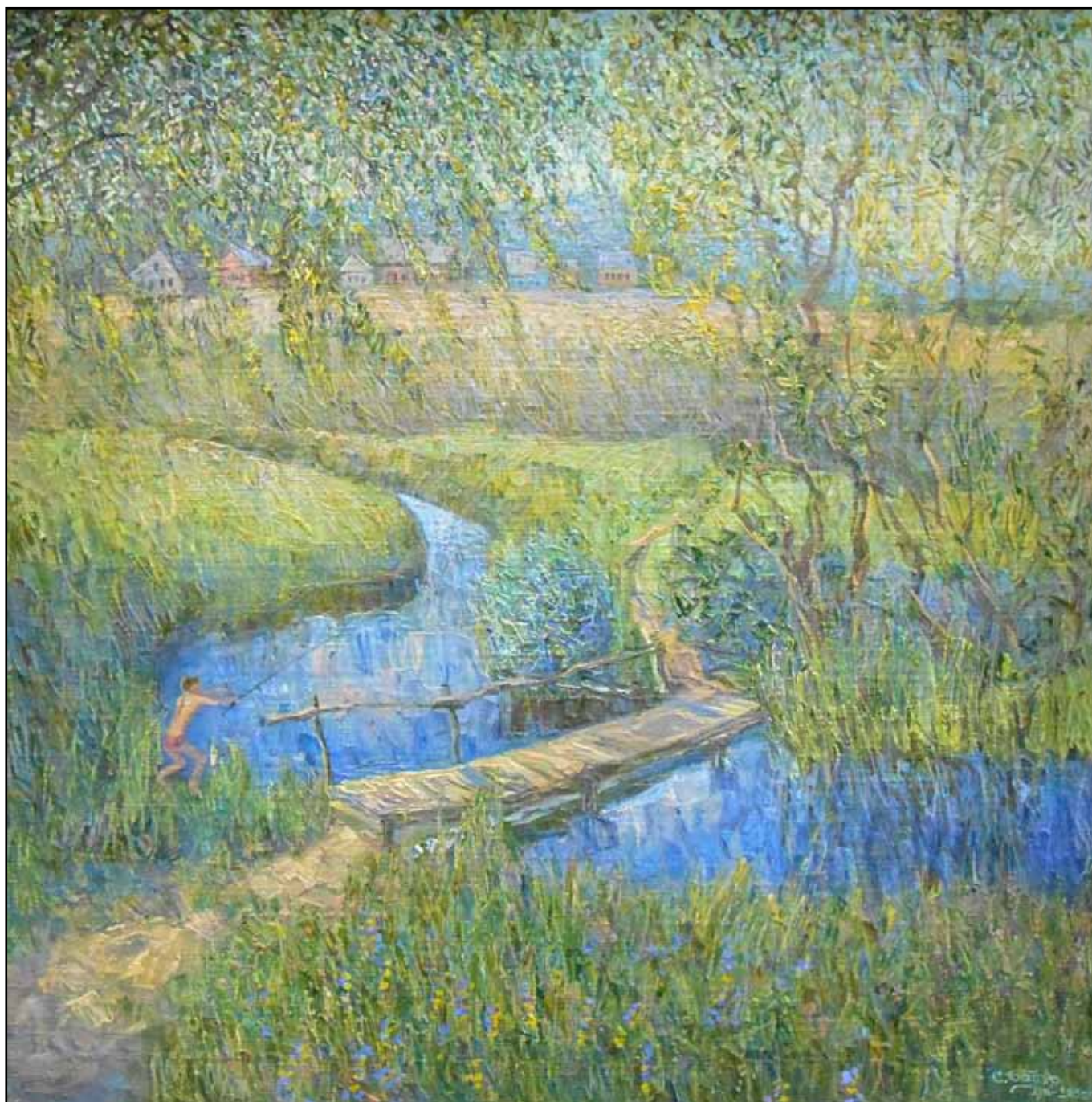
Летний вечер на Каменке. 2017. Холст, масло. 145x220.