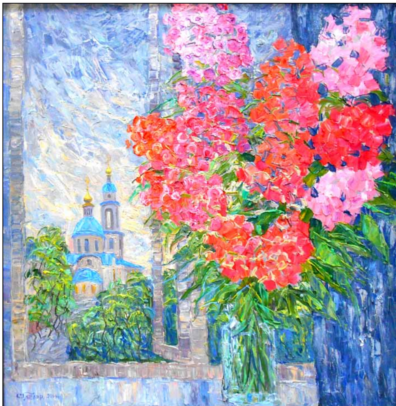
Дождь прошел в Малоярославце. 2017. Холст, масло. 145x220.