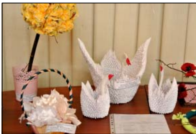
2 июня состоялось открытие детских клубных площадок при Центре «Гармония».