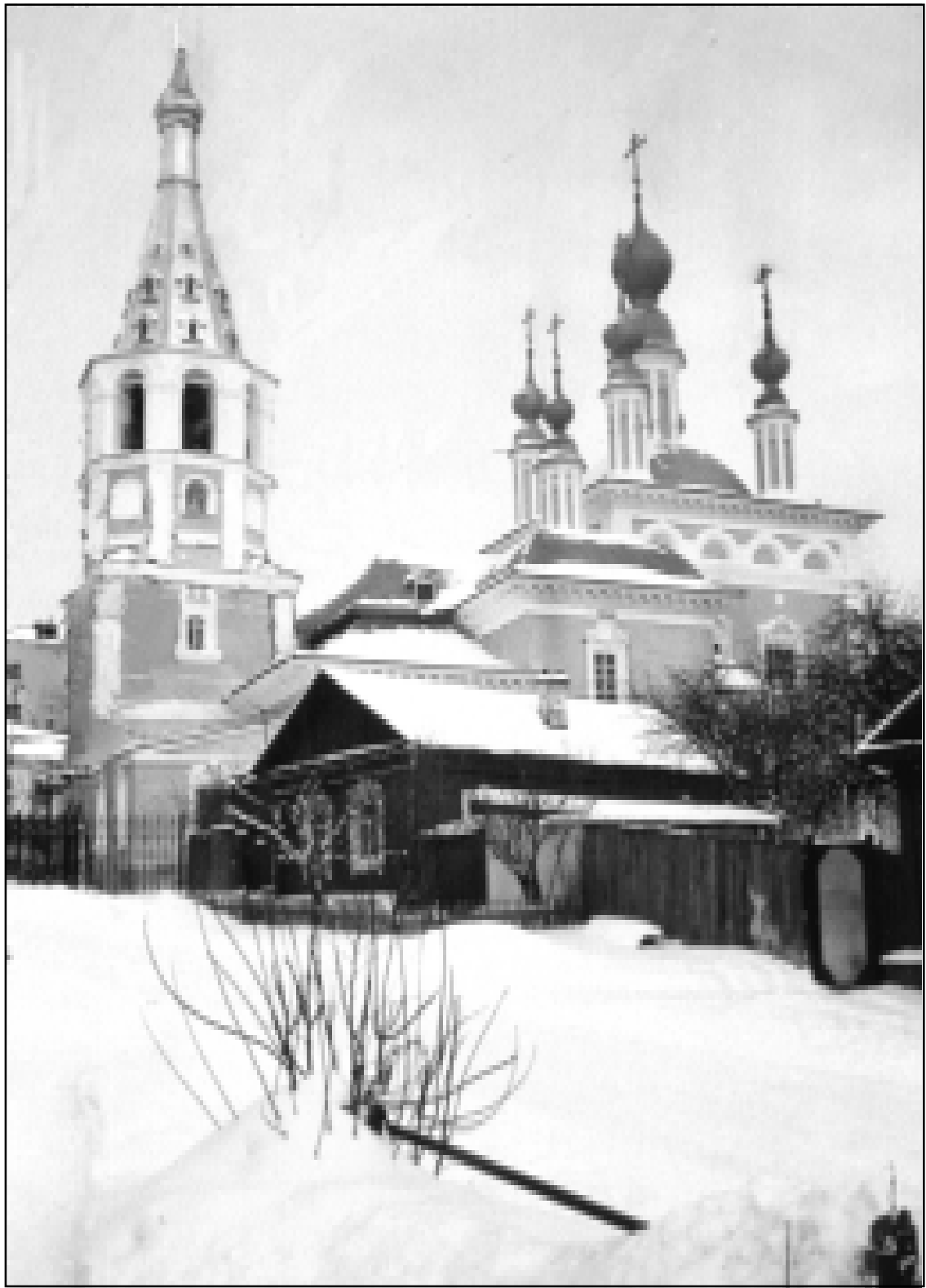
Храм Знамени Пресвятыя Богородицы в г. Калуге. 2000 г.