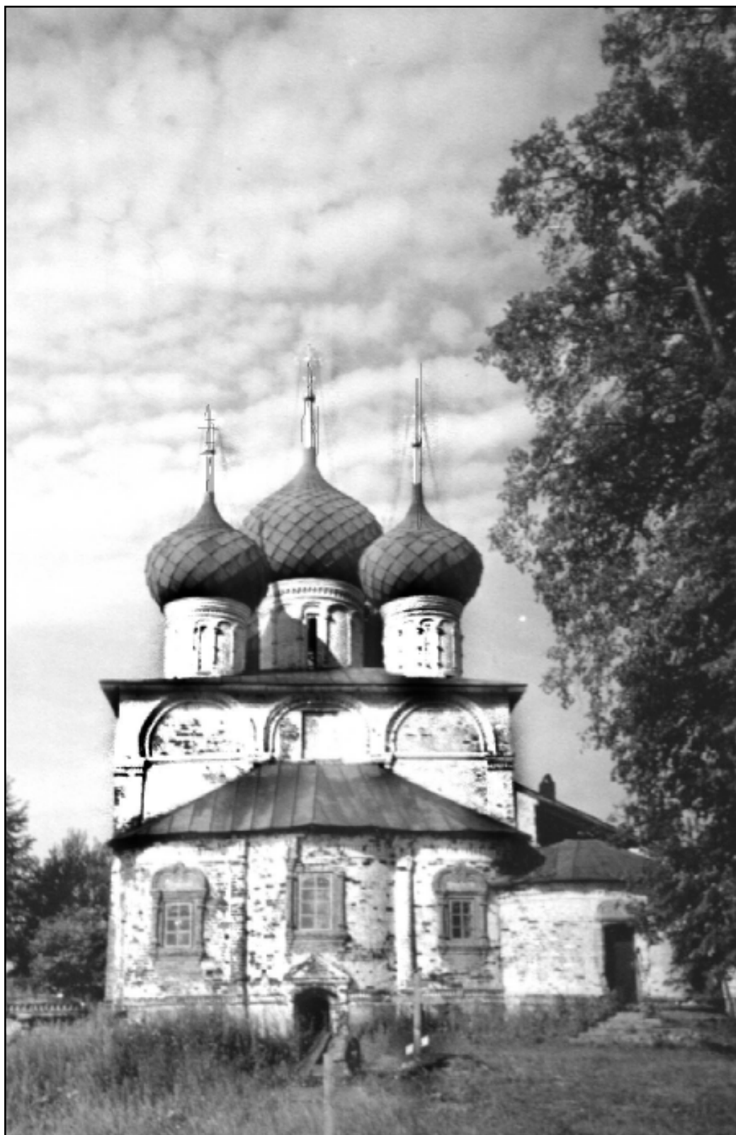
Храм во имя святителя Николы. Старообрядческий Николо-Улейменский женский монастырь. 1999 г.