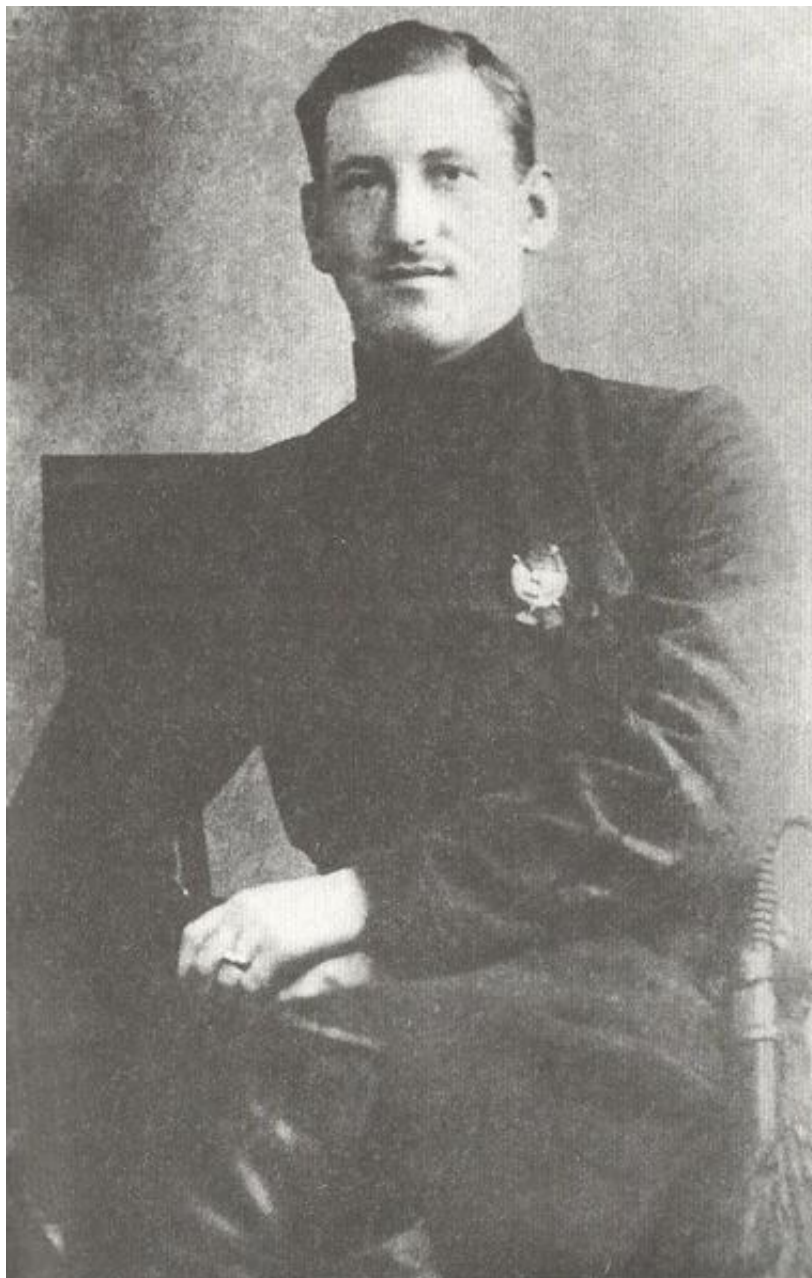
М. Г. Ефремов в годы Гражданской войны

— Личный состав относился к Ефремову, с большим уважением. Он был на хорошем счету у высшего командования. И всегда относился с пониманием к солдатам.