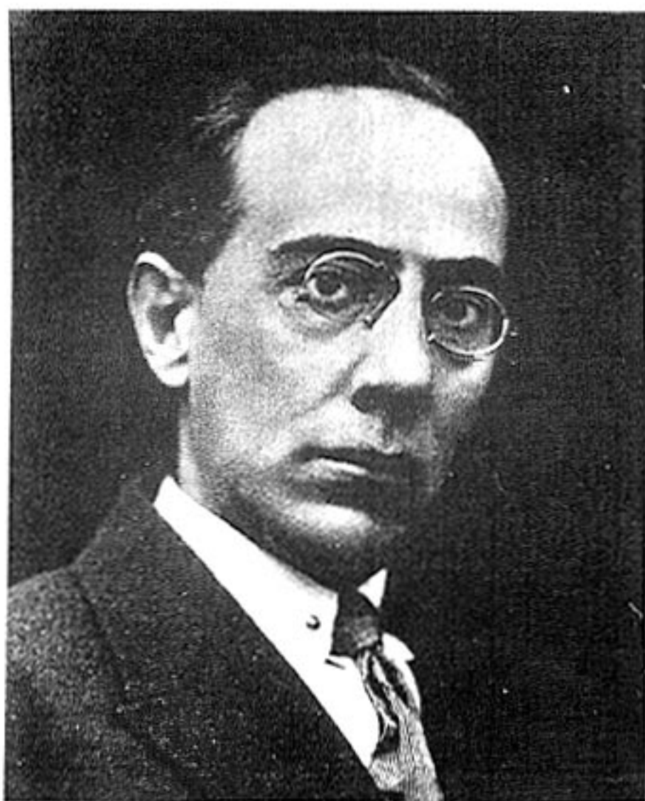
А. Р. Беляев. Снимок начала 30-х гг. прошлого века

доплавания», «Будущее Земли и человечества», «Растение будущего», научно-фантастическую книгу «Тяжесть исчезла» (так по-новому стала называться его повесть «На Луне»), философскую работу «Монизм Вселенной».