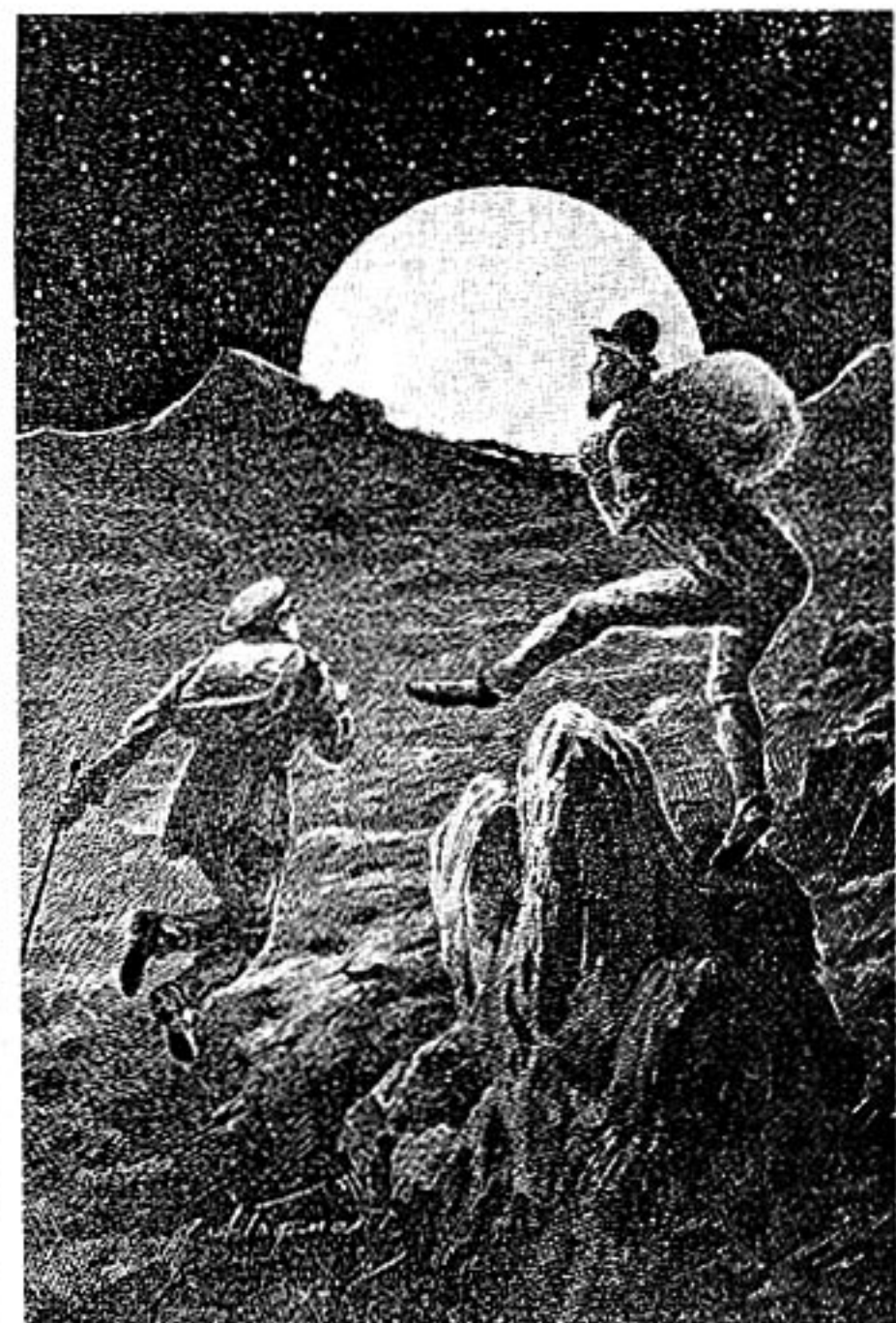
Рисунок А. Гофмана к повести К. Э. Циолковского «На Луне»

Осенью 1893 г. в приложении к московскому журналу «Вокруг света» появилась научно-фантастическая повесть «На Луне». Автором её был учитель Калужского уездного училища Константин Эдуардович Циолковский.