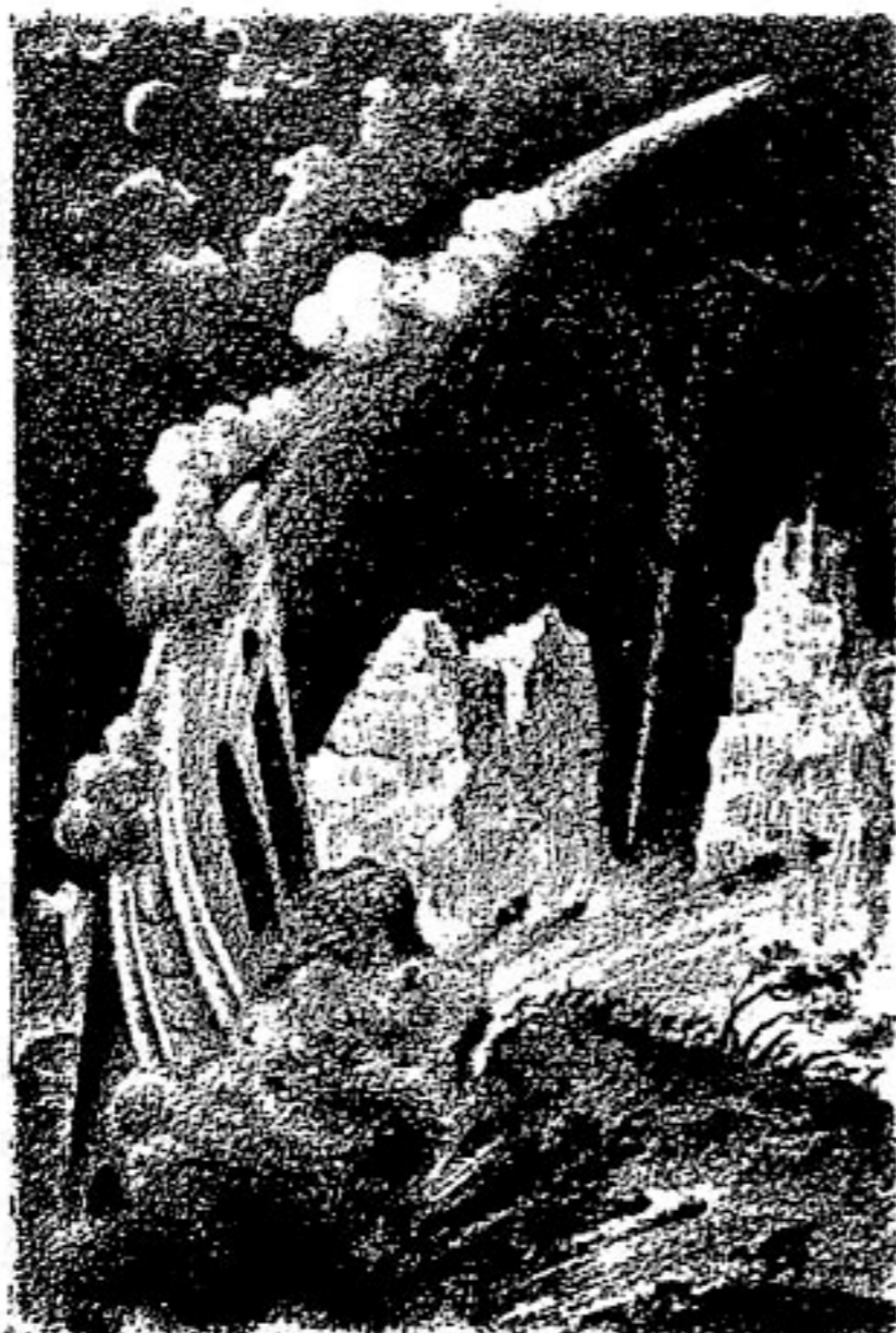
МОЛОДАЯ ГВАРДИЯ ЛЕНИНГРАДСКОЕ ОТДЕЛЕНИЕ 1934