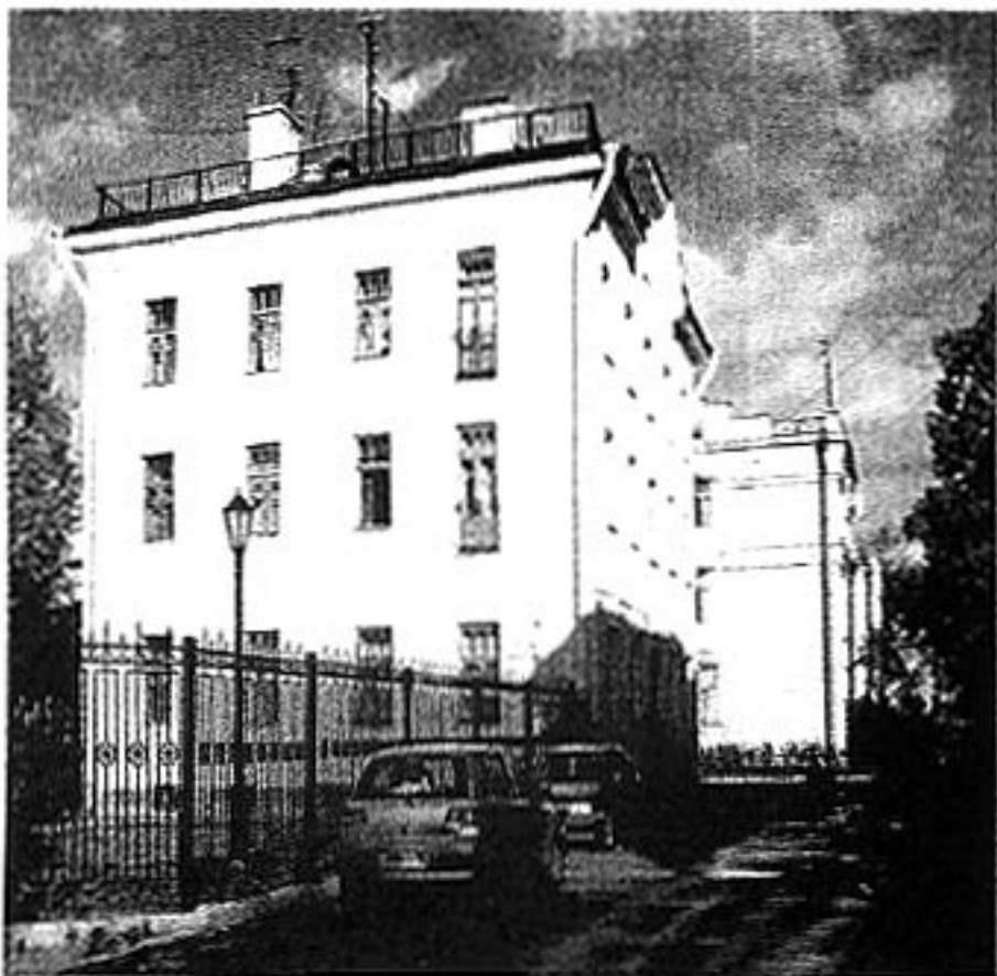
В этом доме на улице Конюшенной, 19 в городе Пушкине жил А. Р. Беляев

Работа над переизданием романа продвигалась медленно. Редакция и рецензент Я.И.Перельман выдвигали требования, с которыми Беляеву трудно было согласиться.