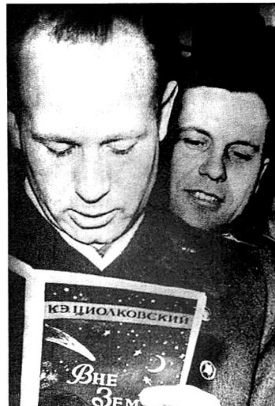
Космонавты Алексей Леонов и Павел Попович с книгой К. Э. Циолковского «Вне Земли»

Пока ещё осторожно учёный писал об освоении человеком космиче-