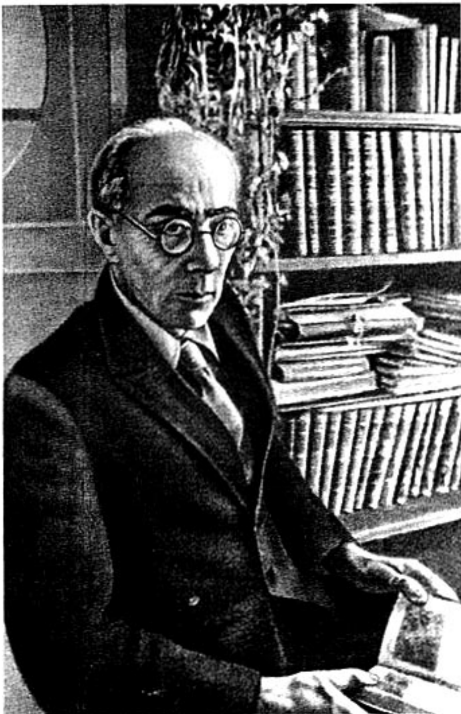
А. Р. Беляев. Снимок 1940 г.

Переписка у К.Э. Циолковского была обширной. Письма ему приходили со всех концов нашей страны от людей самых разных. И поразительно, что большую часть писем, несколько тысяч, он сохранил. Теперь они находятся в Архиве Российской Академии наук, в фонде под № 555. Среди них — семь, полученных основоположником теоретической космонавтики от писателя-фантаста Александра Беляева.