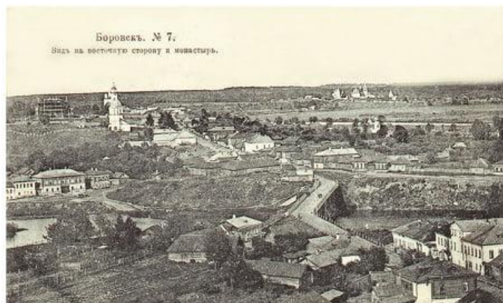
Боровск. Фото нач. XX в.

2. Синодик священнослужителей: Книга 1. Часть 2. Боровский уезд. / Составитель В.В. Легостаев. Калуга, 2008. С.23. — далее — Легостаев. Синодик.