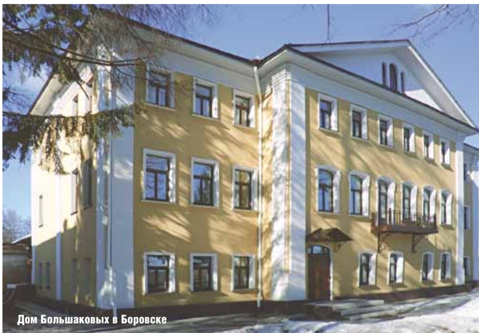
Дом Большаковых в Боровске