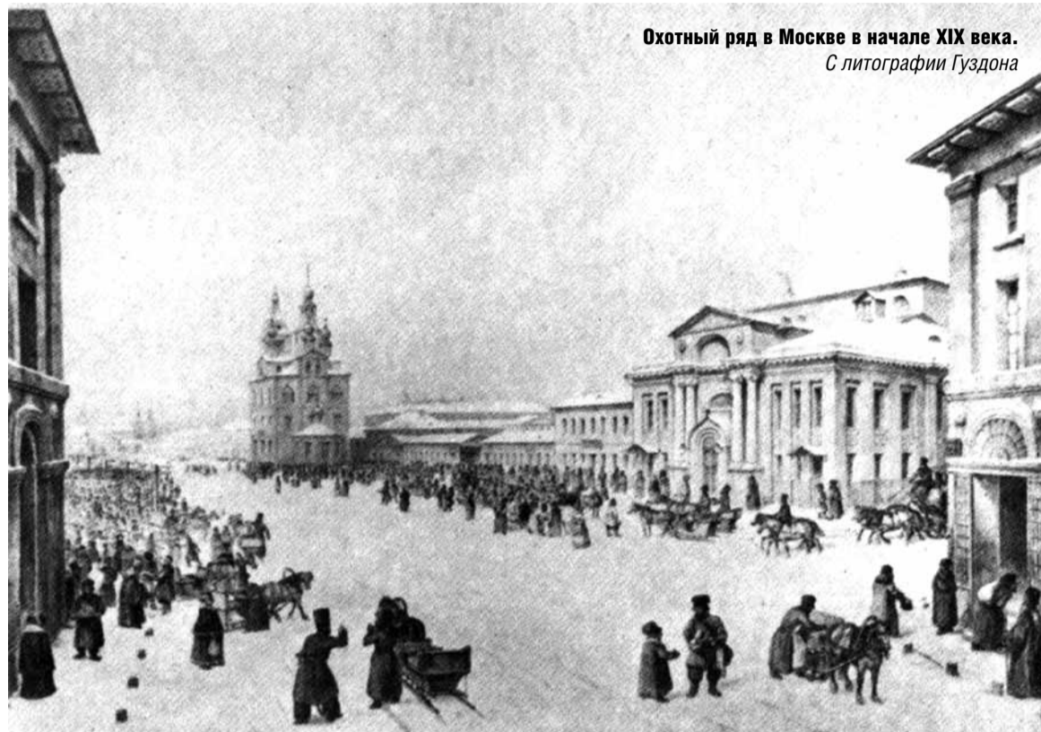
Охотный ряд в Москве в начале XIX века. С литографии Гуздона

Вот так три поколения семьи Большаковых, выходцев из Боровска, подарили Москве огромные коллекции антикварных рукописных и печатных изданий, позволили расширить фонды библиотек и музеев. ♥