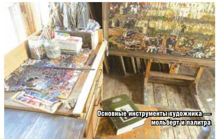
Основные инструменты художника — мольберт и палитра