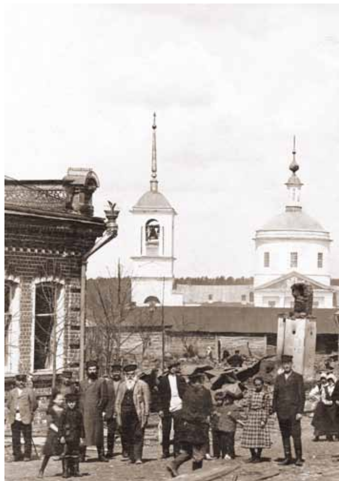
Дом Виноградовых на ул. Калужской после пожара. Боровск, 1910 г.

Так же для пополнения городской казны дума сдавала в аренду здания, находившиеся в собственности городского общества, под трактиры, питейные дома и лавки. Часть их сгорела в пожаре. Восстановлением утраченного недвижимого имущества занялся городской голова А.К. Нечаев. На свои собственные деньги он отстроил близ Конной площади новый деревянный