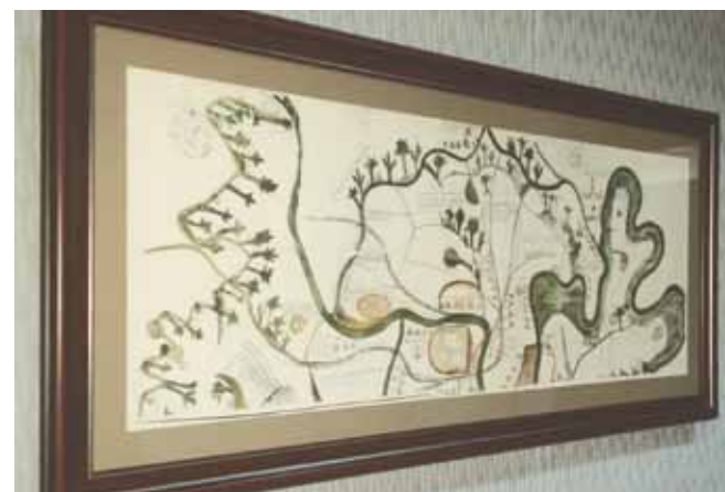
БОРОВСК НА СТАРИННЫХ ЧЕРТЕЖАХ И ПЛАНАХ

В Музейно-краеведческом комплексе «Стольный город Боровск» 14 июля открылась новая выставка — «Боровск на старинных чертежах и планах».