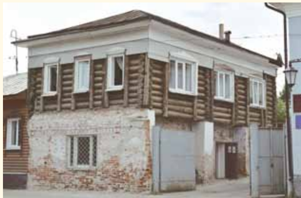
Уничтожение исторического облика здания на Ленина, 30 в ходе текущей реконструкции