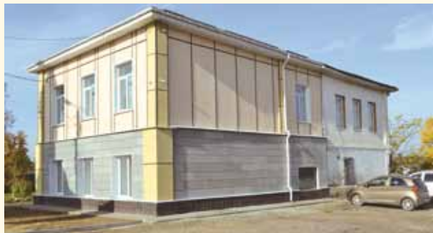
Искажение облика исторического здания на Советской, 6а

В последние десять лет ни один руководитель не обходится без разрушения хотя бы одного историче-