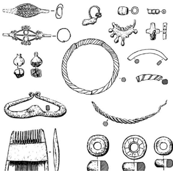
Артефакты домонгольского периода, найденные при раскопках

тов (из 3000 найденных) могли быть уверенно датированы XII—XIII вв.