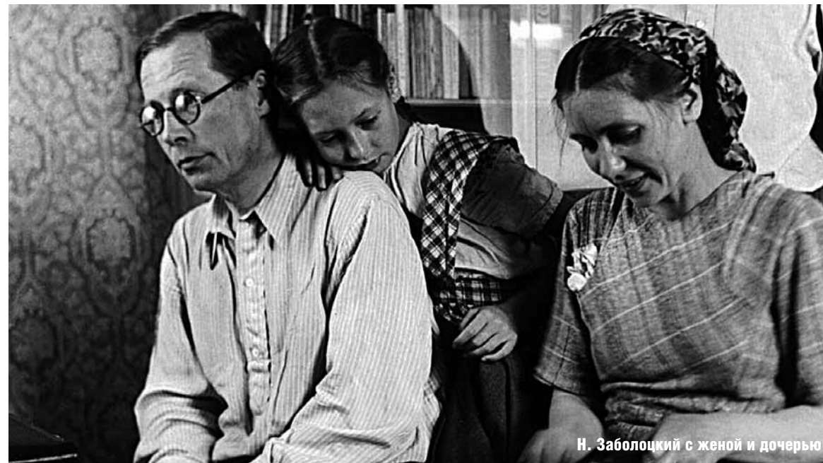
Н. Заболоцкий с женой и дочерью