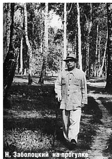
Н. Заболоцкий на прогулке

«Пишу вам с той почтительной робостью, с какой писал бы Тютчеву или Державину. Для меня нет никакого сомнения, что автор «Журавлей», «Уступи мне, скворец, уголок...», «Неудачника», «Актрисы», «Человеческих лиц», «Утра», «Лесного озера», «Слепого», «В кино», «Ходоков», «Некрасивой девочки», «Я не ищу гармонии в природе...» — подлинно великий поэт, творчеством которого рано или поздно советской культуре (может быть, даже против воли) придётся гордиться как одним из высочайших своих достижений. Кое-кому из нынешних мои строки покажутся опрометчивой и грубой ошибкой, но я отвечаю за них всем своим семидесятилетним читательским опытом».