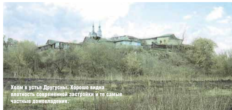
Холм в устье Другусны. Хорошо видна плотность современной застройки и те самые частные домовладения.

Раскопки археологов позволили выявить чрезвычайно удачное расположение Детинца и посада Козельска XII—XIII вв.: они находились в своеобразной «петле», которую создавала Другусна перед впадением в Жиздру. При этом сам Детинец отделялся от посада оврагом, а с других сторон при-