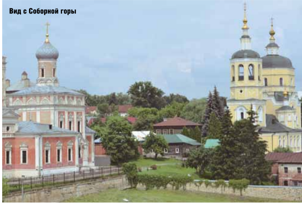
Вид с Соборной горы

Перед поездкой очень переживали, что с момента нашего первого визита в Серпухов в 2009 г. город утратил свою историческую подлинность, поскольку из Серпухова приходят тревожные вести о расселении ветхого жилого фонда и последующем уничтожении ценных градоформирующих объектов (типичная для исторических городов России картина).