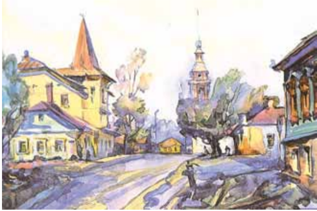
Калуга. Старая улочка. 1988

Родился он на Кольском полуострове, в городе Мончегорске, в 1942 году. В 1963 окончил живописно-педагогическое отделение Ленинградского художественного училища им. В. А. Серова. С 1966 года работал в художественно-производственных мастерских в Калуге, несколько лет преподавал в детской художественной школе. С 1967 года стал активным участником выставок – городских, областных, республиканских. Оформлял книги в Приокском издательстве. В 1989 году был принят в Союз художников России.