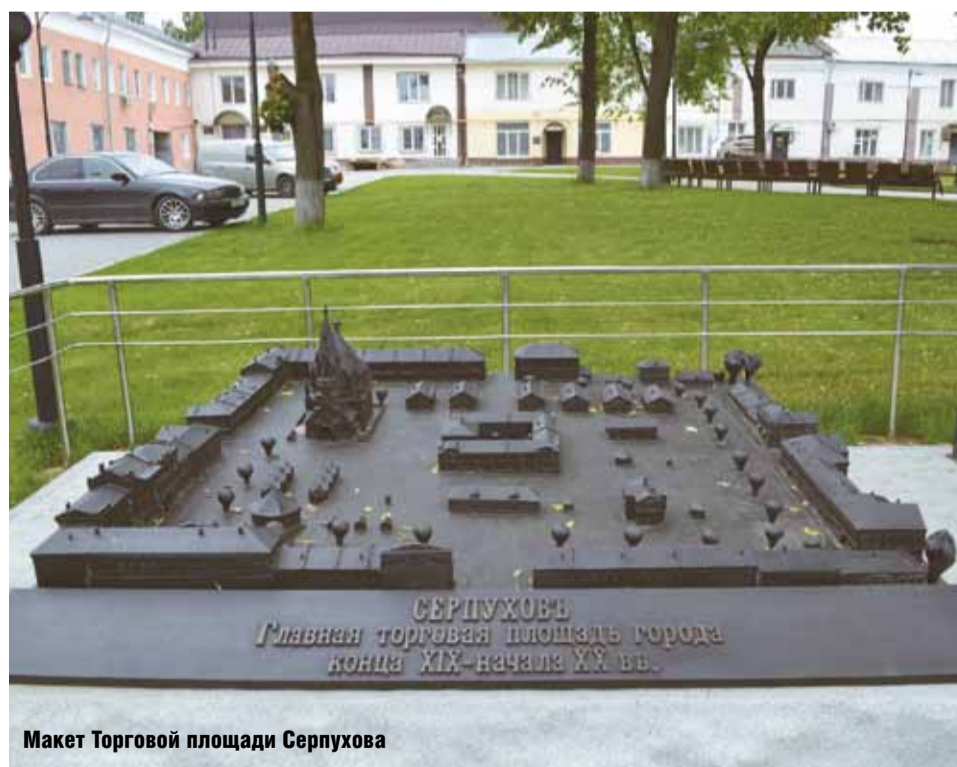
Макет Торговой площади Серпухова

Историческим сердцем Серпухова является Соборная гора. Именно здесь еще во времена князя Владимира Андреевича Храброго был заложен дубовый кремль, который в XVI в. был перестроен в белокаменную