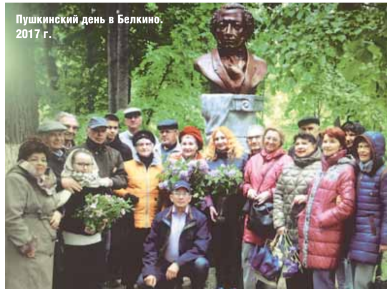
Пушкинский день в Белкино. 2017 г.

В июле этого года Обнинску исполняется 65 лет со дня рождения. Это, по меркам города, – детство, хотя позади – целая эпоха: покорение атома, интеллектуальный расцвет, научное лидерство, вольнодумная смелость, молодой энтузиазм, завидная демография, уникальность – на Калужской земле. Сколько незабываемых имён: Пётр Кончаловский, Николай Тимофеев-Ресовский, Сергей Городецкий, Жорес Медведев! Перечень можно долго продолжать – до наших дней. Сама губернская Калуга, при всей своей истории, красоте и насыщенности, частенько комплексовала рядом с этим «выскочкой». Но при столь короткой дистанции (даже не столетней протяжённости!) – многое уже позади, время не прищипорить. Можно, правда, остановиться и оглянуться. Каков он сегодня – первый российский наукоград? Весь в зелени и цветении, многоэтажках, кафешках и ресторанах, торговых комплексах, оздоровительных центрах, спортзалах с бассейнами, в избыточных машинах и голубях, с нередкими белками, сойками, скворцами, дятлами в парках, с регулярными столичными «звездами» в культурных программах... Такая маленькая Москва – при удобстве транспорта и без гигантомании столицы. Очень удобное для жизни место во всех отношениях! Про недостатки – молчок, не юбилейное это дело. Сегодня – только хорошее, соответствующее дате и реальности, и лучше – стихами.