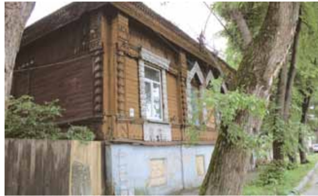
О СУДЬБЕ ДОМА ЦИПУЛИНА В КАЛУГЕ