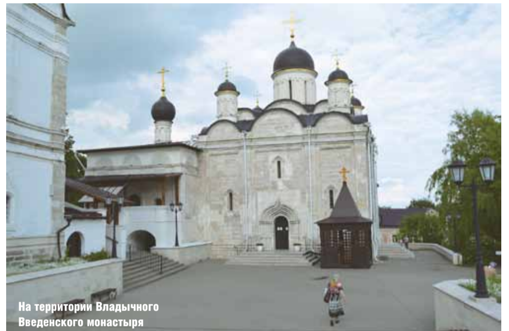
На территории Владычного Введенского монастыря

Невского, который был построен в кон. XIX в., а в 1934 г. разрушен советской властью.