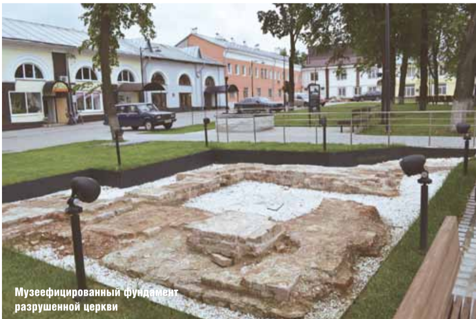
Музейфицированный фундамент разрушенной церкви