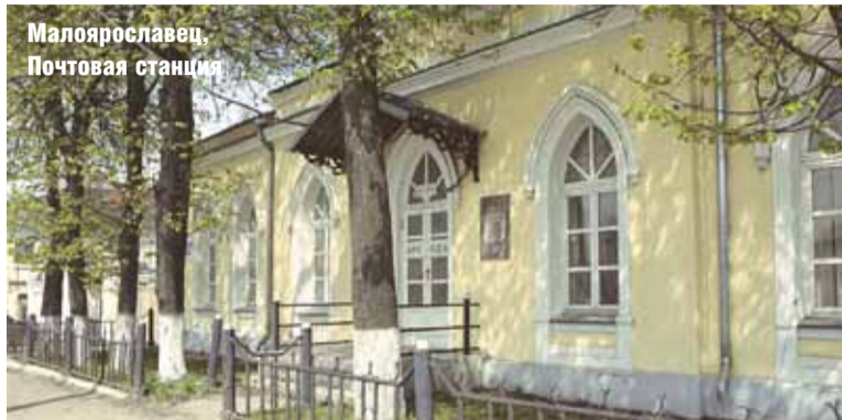
Малоярославец. Почтовая станция

Как и на всех дорогах России за проезд и провоз груза по Варшавке была установлена специальная плата — шоссепутный сбор. 15 января 1847 г. император Николай I издал указ о размерах дорожного сбора от Бобруйска до Брест-Литовска. Дорожный налог — шоссепутный сбор в пунктах сбора на шоссепутных заставах, к примеру, «средним числом, за 6 лет, считая с 1845 г. собирается: на Подольской до 9,127 руб. серебром, а на Лукьяновской 7,427 руб. серебром».