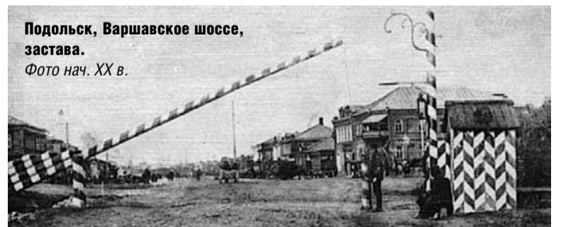
Подольск, Варшавское шоссе, застава. Фото нач. XX в.

ным твердым покрытием и обязательным грунтовым основанием, а также с канавами для стока воды по обочинам.