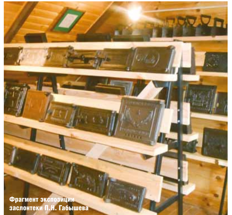
Фрагмент экспозиции заслонки П.Н. Габышева

В 1959 г. в состав завода вошел Ленинградский государственный завод «Красный метал-