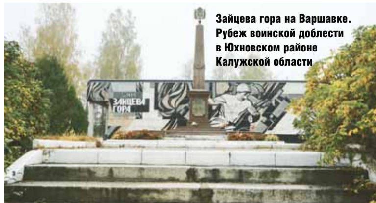
Зайцева гора на Варшавке. Рубеж воинской доблести в Юхновском районе Калужской области