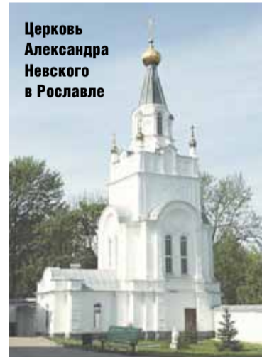
Церковь Александра Невского в Рославле

Варшавское шоссе пересекало Калужскую губернию на протяжении 250 км. В Боровском уезде шоссе прошло через 11 поселений, входивших тогда в его состав: Горки, Молотихин (постоялый двор), Панина, Чубарова, Бухаловка, Воробы, Добрый приют (постоялый двор), Дроздовская (почтовая стан-