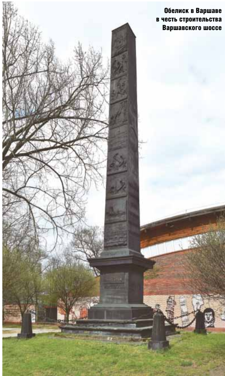
Обелиск в Варшаве в честь строительства Варшавского шоссе

В отдельных источниках встречаются наименования Московское, Москва-Бобруйск, Московско-Брестское, Старое Варшавское, Старая Польская дорога, Брест-Варшавское.