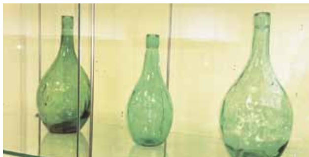
«ПУЗЫРЬКИ, ПУЗЫРЁЧКИ, БУТЫЛОЧКИ...»

В музейно-краеведческом комплексе «Стольный город Боровск» представлена выставка «Пузырьки, пузырёчки, бутылочки...»