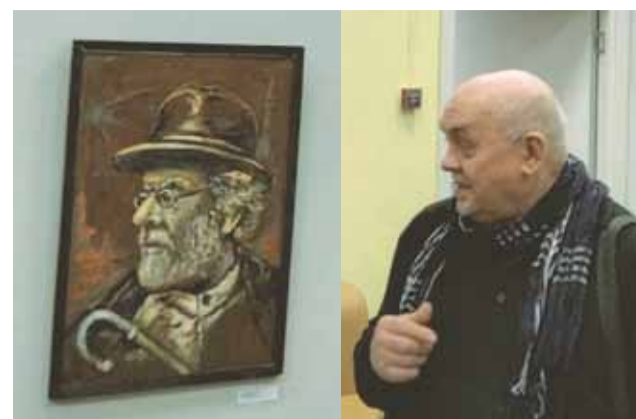
«Предчувствие космоса», худ. В. Черников