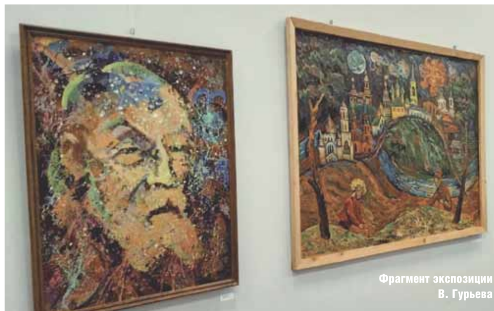
Фрагмент экспозиции В. Гурьева

Таким, как говорится и карты в руки, в том числе – и космические. Ведь буквально за неделю до выставки Министерство культуры РФ приняло решение о придании Боровску статуса исторического поселения федерального значения.