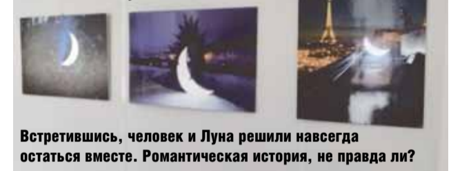
Встретившись, человек и Луна решили навсегда остаться вместе. Романтическая история, не правда ли?