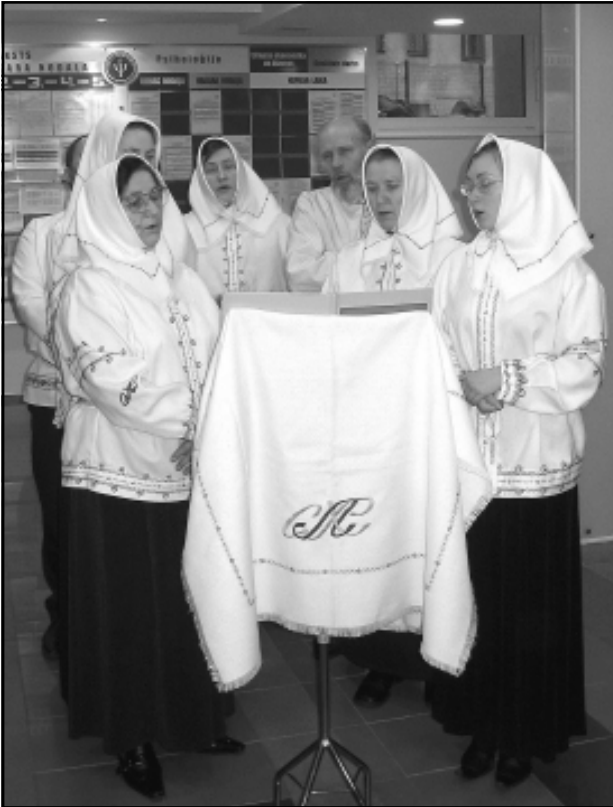
Выступает хор «Грезн»