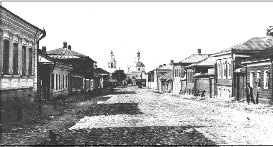
Пятницкая улица. Фото 1910-х гг.

ством выдаются такие же пособия бедным из процентов с капиталов, пожертвованных на этот предмет некоторыми жителями города. Все эти пособия выдаются преимущественно перед праздниками Рождества Христова и св. Пасхи. В городе имеются: городской общественный братьев Протопоповых банк, с основным капиталом в 14000 руб.; ссудная касса; 5 страховых обществ (3). Ярмарок в городе бывает 2: одна с 1 по 7 января, другая в день Вознесения Господня (4). Базары бывают еженедельно по понедельникам и четвергам. Предметы торга скот и сельскохозяйственные продукты. Общий