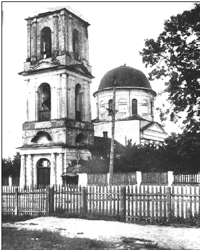
Церковь Успения на ул.Успенской (ныне ул.Ленина). В настоящее время на этом месте находится кинотеатр «Родина». Фото А.П.Девятова, 1936г.

полицейского управления и женской прогимназии. На этом месте есть камень, под коим покоится прах боярынь Урусовой и Морозовой. Старообрядцы чтут их память и служат здесь иногда панихиды.