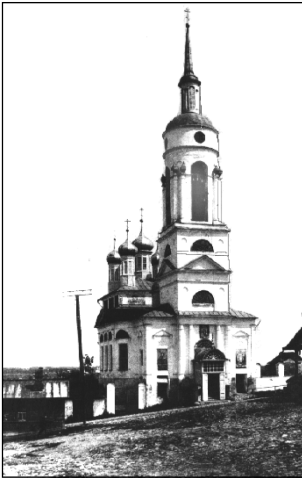
Благовещенский собор. фото 1910-х гг.

и заводов 19, на которых работает 244 чел. Сумма производства достигает