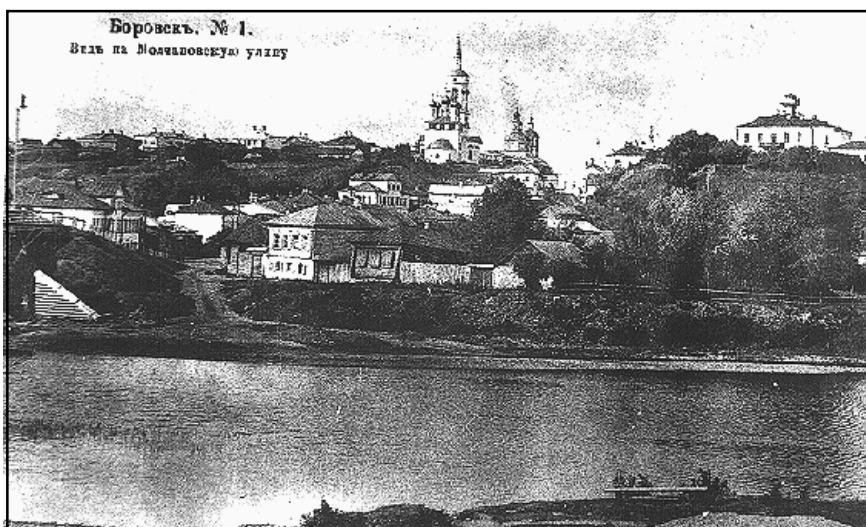
Вид на Молчановскую улицу. Фото 1910-х гг.