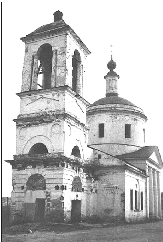
Церковь Преображения на Взгорье (1804 г.). Фото В.И.Осипова, 1998 г.

чале 1960-х гг. была взорвана Успенская церковь, вместо которой появилось приземистое здание кинотеатра