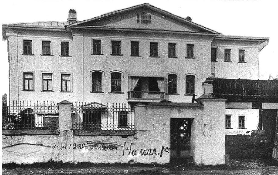
Дом на ул. Успенской (ныне ул. Ленина, д.12). По преданию, в октябре 1812г. здесь останавливался Наполеон. Фото 1910-х гг.

Пафнутиев монастырь. В первый раз его отправили сюда в конце 1665 г. и продержали до 13 мая 1666 г., когда представили его на Собор: «и туда присылка была, тоже да тоже говорят: «полно тебе мучить нас, соединишь с нами, Аввакумушко!» С 3 сентября 1666г. до 30 апреля 1667 г. его