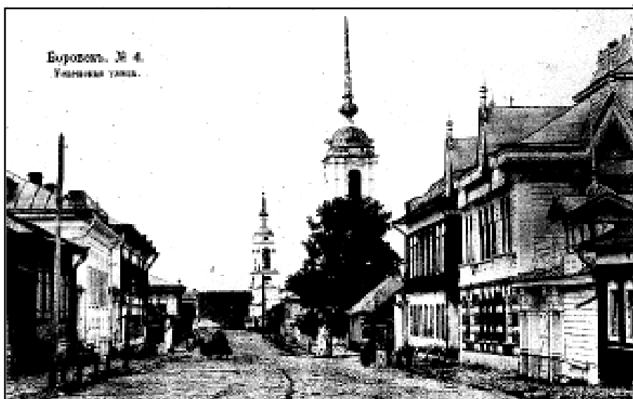
Успенская улица. Фото 1910-х гг.