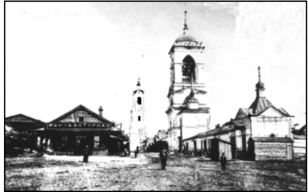
Слобода Мстёра. Фото нач. XX в.