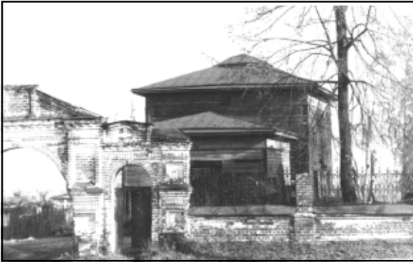
Мстёра. Троицкая единоверческая церковь. 1987 г.

камилавкой, в 1913 г. — наперсным крестом. 11 июня 1916 г. переведён из Мстёры к Вязниковскому Благовещенскому женскому монастырю.