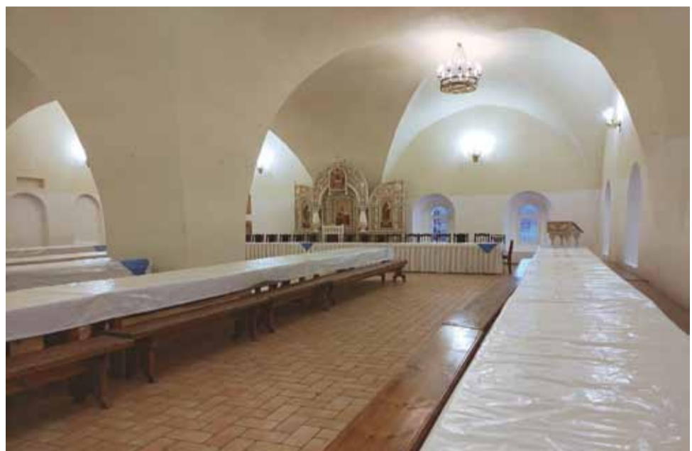
Трапезная Пафнутьев-Боровского монастыря. Одностолпная палата. 1511 г.