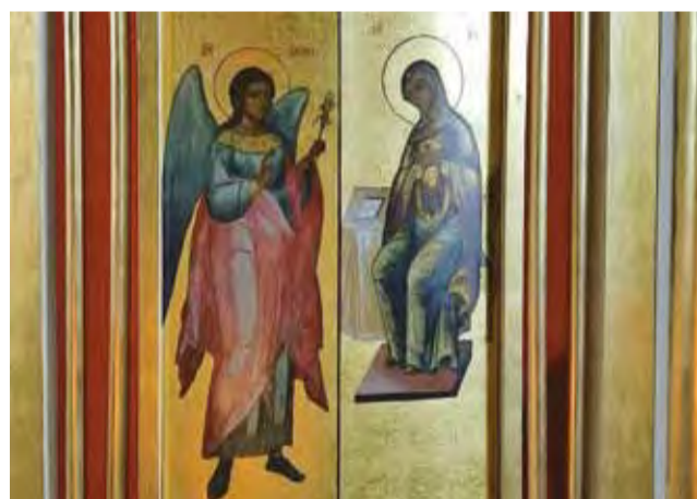
Благовещение. Деталь царских врат. 1810-е гг. Благовещенский собор в Боровске.

Очень мало у нас городов, сохранивших дореволюционные церковные интерьеры. В Боровске сохранились три, не считая ценнейших фресок XVII века в Пафнутьев-Боровском монастыре. Это очень много. Десять старинных иконостасов, в том числе уникальных. И... большую их часть смотреть весьма затруднительно.