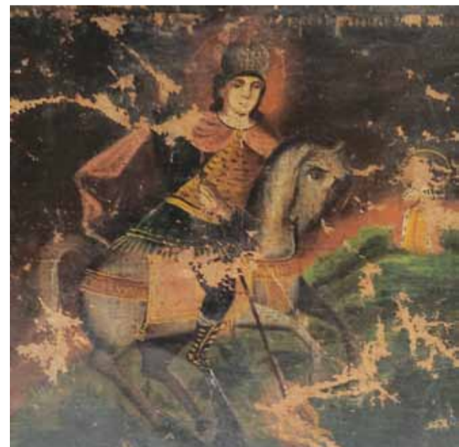
Чудо Георгия о змие. XIX в. Икона. Музей Благовещенского собора

но и предоставлять возможность для их изучения. Пусть даже простые туристы будут иметь возможность увидеть эти произведения, восхититься ими и приобщиться к подлинной культуре. Если эти уникальные произведения будут широко известны, их нельзя будет свободно продать, а значит потенциальные грабители потеряют к ним интерес. Но пока