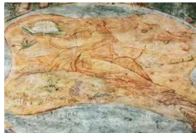
Земля отдает мертвых. Фреска собора Рождества Богородицы Пафнутьев-Боровского монастыря. 1644 г.