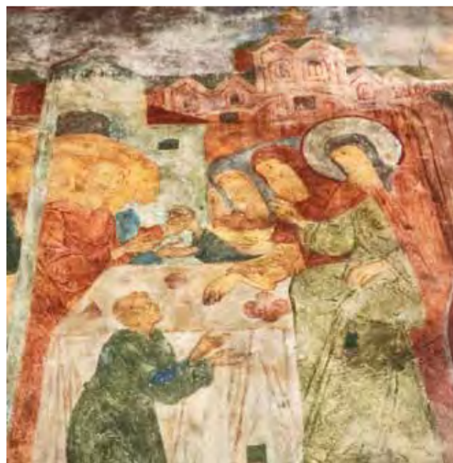
Святой Пафнутий питает странников и нищих. Фреска собора Рождества Богородицы Пафнутьев-Боровского монастыря. 1644 г.

мания видеть в туристах потенциальных грабителей, увы, не уходит.