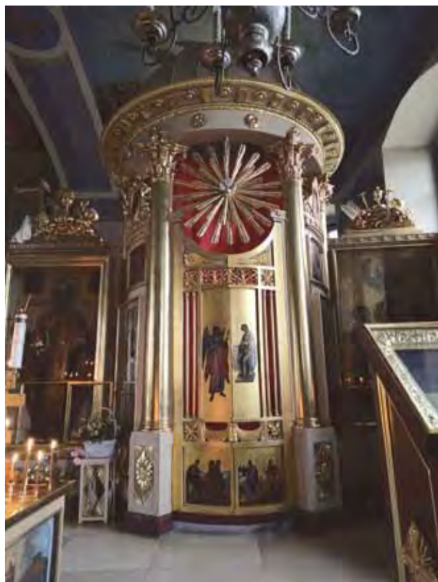
Царские врата и иконостас правого придела Благовещенского собора. 1810-е гг.

Иконопись XVII-XIX вв. говорит о наличии неплохих собственных (это следует из подписных вещей) мастерских. Эта иконопись не самая профессионально-крутая из того, что видел, но своей яркостью красок, отчетливым