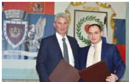
Боровск и Топола – города побратимы, 2015