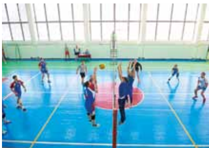
Волейбольный турнир на Кубок газеты «Боровские известия», 2017