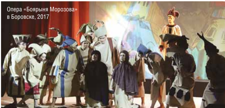
Опера «Боярыня Морозова» в Боровске, 2017