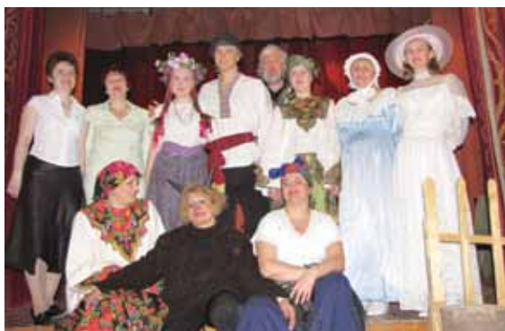
Спектакль «Чудеса, да и только...», 2009