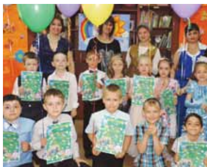
Выпускники программы «Знай-ка» Центра «Гармония», 2015