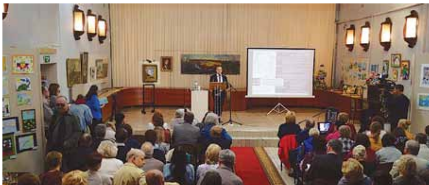
Федоровские чтения в Боровске, 2018