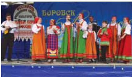
Фестиваль «Живые корни России», 2009