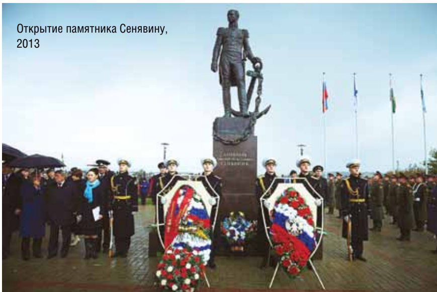
Открытие памятника Сенявину, 2013