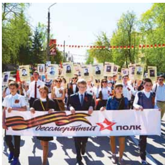
Шествие Бессмертного полка