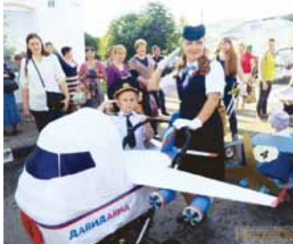
Парад колясок в Боровске