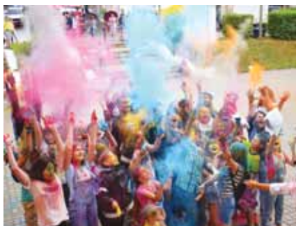
День молодежи. Фестиваль красок, 2018