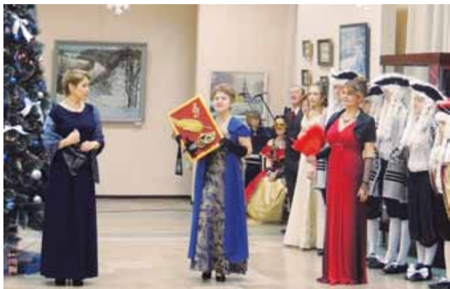
Бал в литературном салоне «И величаво звучит полонез...», 2014