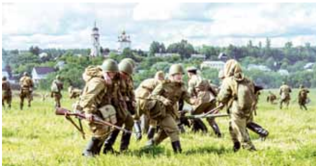
Боровский рубеж, 2018