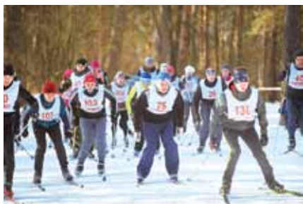
«Боровская лыжня», 2017