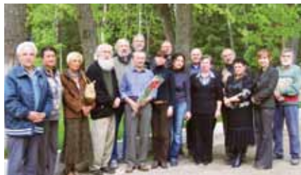
Участники пленэра «Боровская весна», 2008