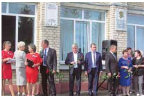
Открытие памятных досок в школе №1 в честь Героев Советского Союза, 2017