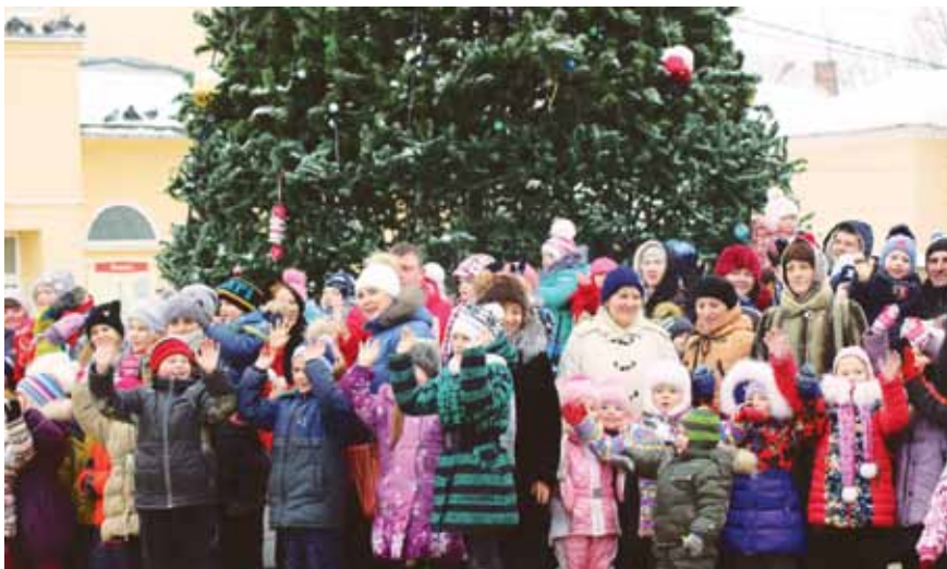
Боровчане открывают Новогоднюю ёлку, 2016