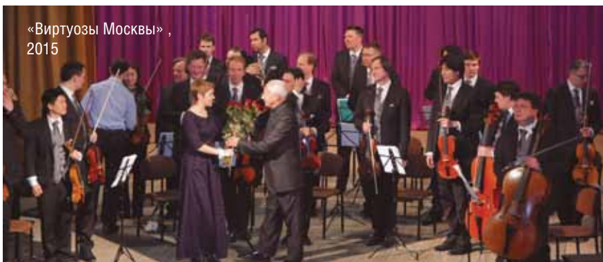
«Виртуозы Москвы» , 2015