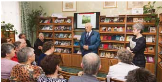
Презентация книги «Вспомним всех поименно» в районной библиотеке, 2016