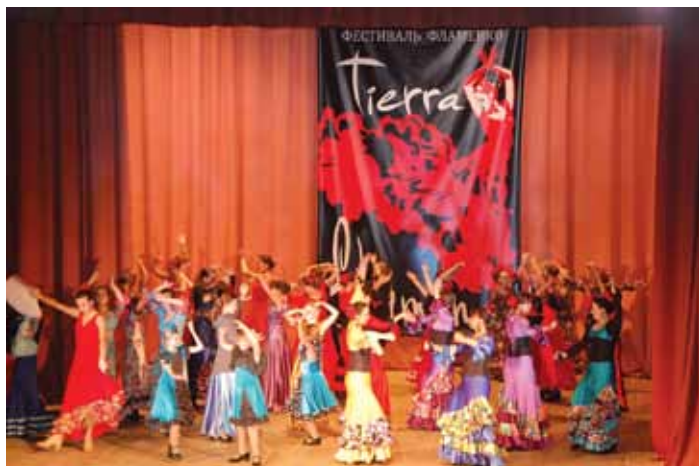
Всероссийский фестиваль фламенко в Боровске, 2016