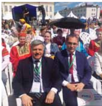
Фестиваль малых туристских городов в Тобольске, 2018