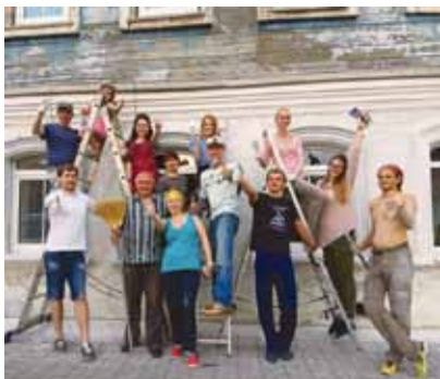
Участники ТомСойерФест, 2017