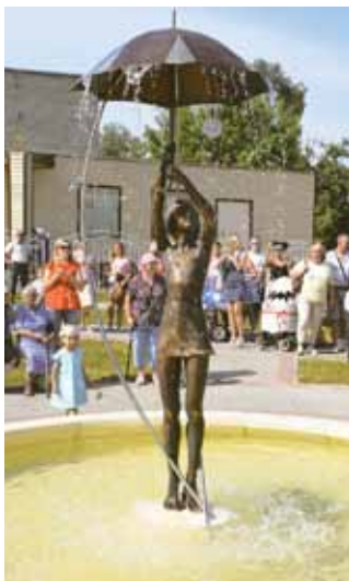
Открытие фонтана «Пусть светит!», 2017