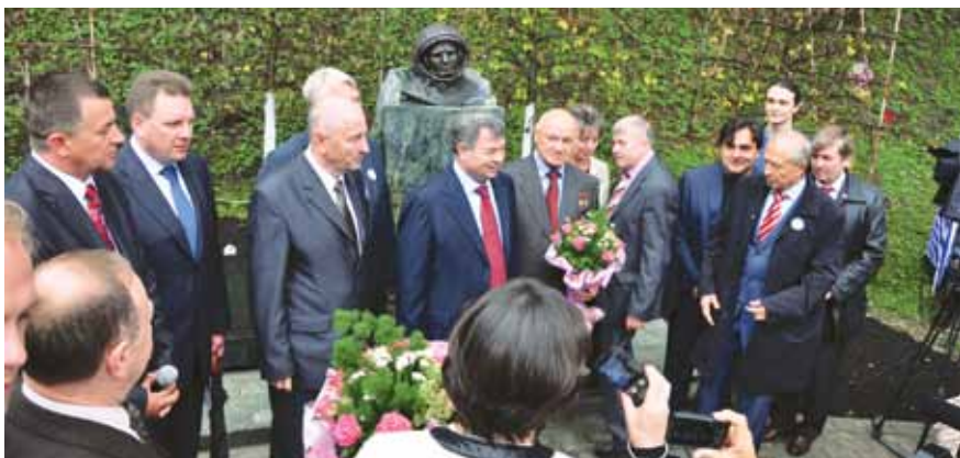
Открытие памятника Ю.А. Гагарину, 2011