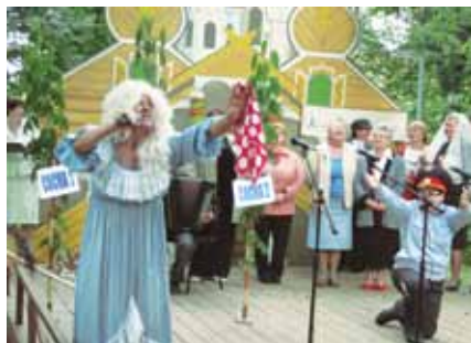
650-летие города Боровска. «День горожанина», 2008