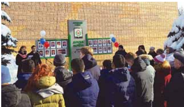
Открытие Доски Почета «Дети – наше будущее», 2018