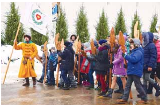
Историко-культурный фестиваль «Оплот веры», 2016