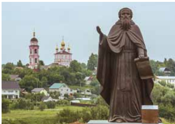
Памятник Святому Преподобному Пафнутию Боровскому, 2016