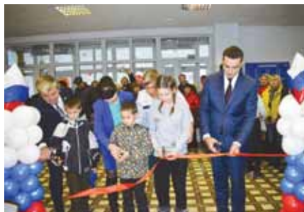
Открытие ФОКа, 2017