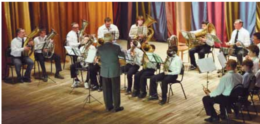
Духовой оркестр РДК, 2011

70-летие освобождения Боровского района от немецко-фашистских захватчиков. Научно- практическая конференция, 2012