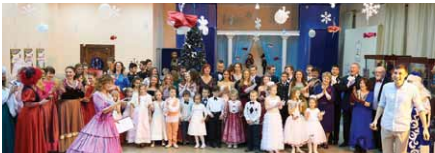
«Театральный бал» в МВЦ, 2016