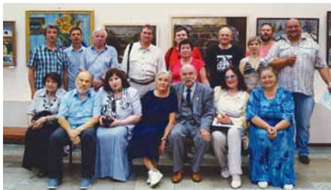
Открытие выставки, посвященной 660-летию Боровска в МВЦ, июль 2018