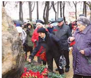
Открытие Соловецкого камня в Боровске, 2017