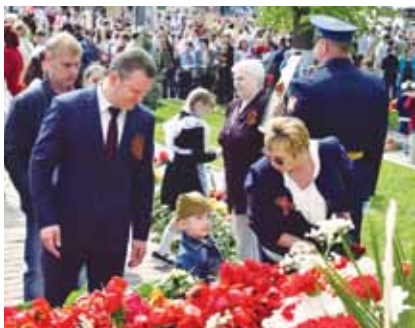
День Победы, 2018