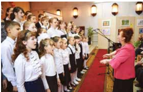
Хор Боровской детской школы искусств, 2014