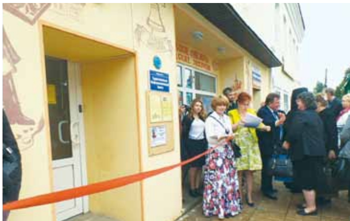
Открытие ТИЦ «Боровский край» в Боровске, 2015