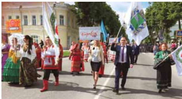
Боровск на фестивале малых туристских городов в Суздале, 2017