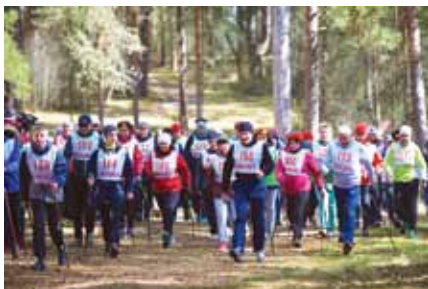
«Боровские скороходы», 2017