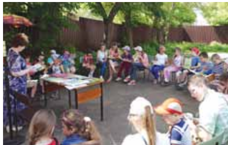
Библиотечный дворик, 2017