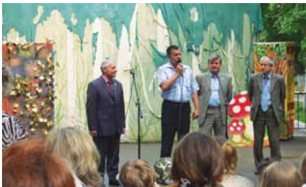
Открытие детского сквера на ул. Коммунистической, 2010