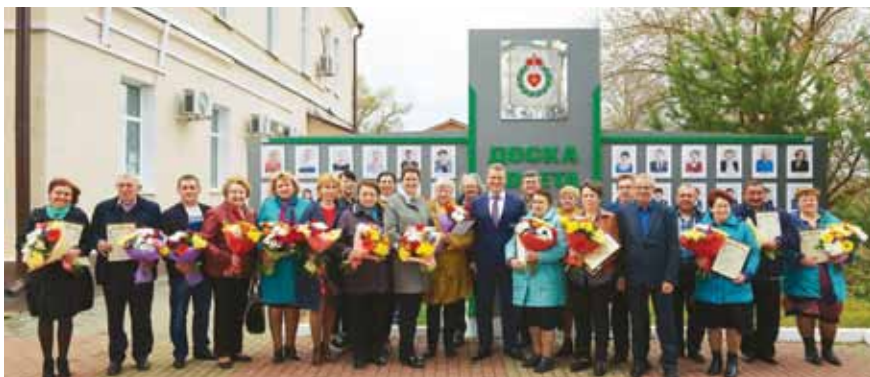
Трудовая слава Боровского района, 2018