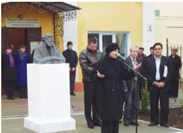
Открытие памятника философу Н.Ф. Федорову, 2009