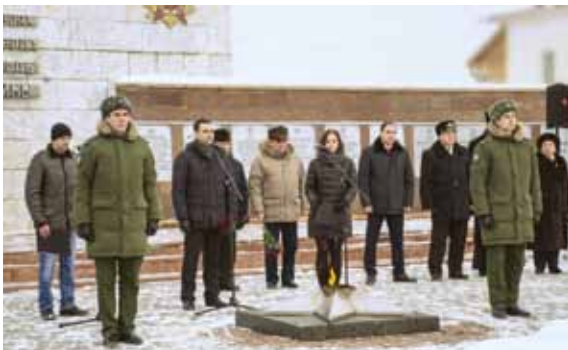
Митинг в честь 75-й годовщины освобождения Боровска от немецкой оккупации, 4 января 2017