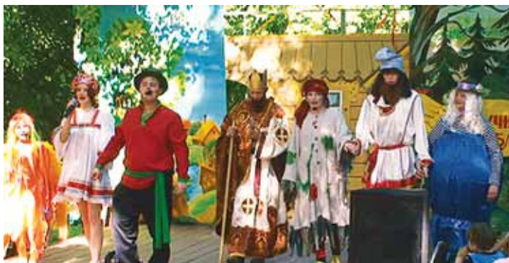
Мюзикл «Летучий корабль» в сквере ГЦИ, 2009