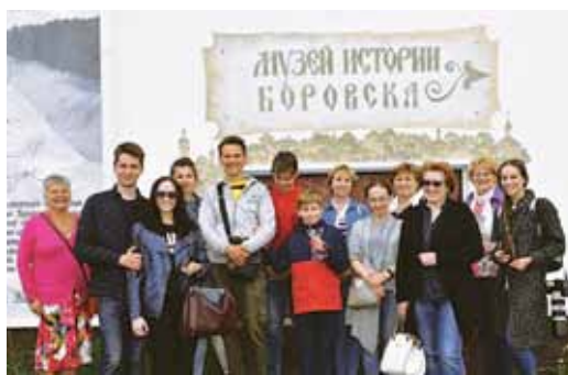
Туристы в Боровске, 2018