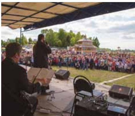
Пасхальный концерт на Высоком, 2017