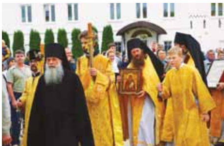
Празднование 1025-летия Крещения Руси, 2013