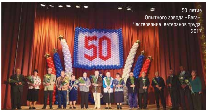
50-летие Опытного завода «Вега». Чествование ветеранов труда, 2017