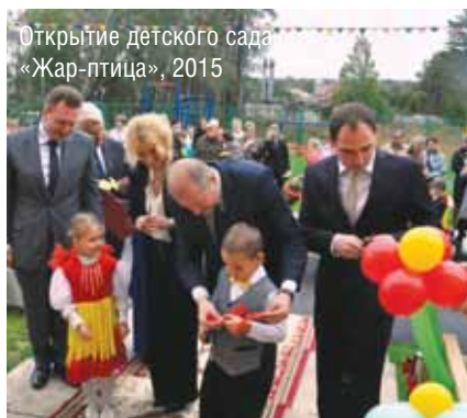
Открытие детского сада «Жар-птица», 2015