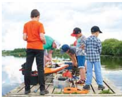
Областной фестиваль судомодельного спорта на Комлевском озере, 2018