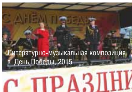
Литературно-музыкальная композиция в День Победы, 2015