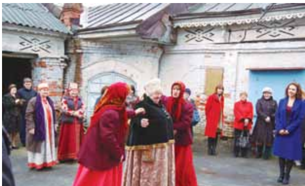
Открытие выставочного зала Школы Мастеров, 2010