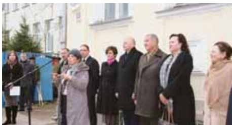
Открытие памятной доски в честь пребывания в Боровске Его Императорского Высочества Великого Князя Михаила Александровича Романова – младшего сына Императора Александра III, 2013