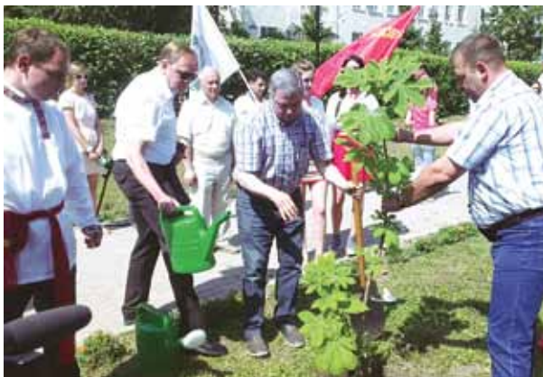
Губернатор области А.Д. Артамонов на «Субботнике в рубашке», 2017